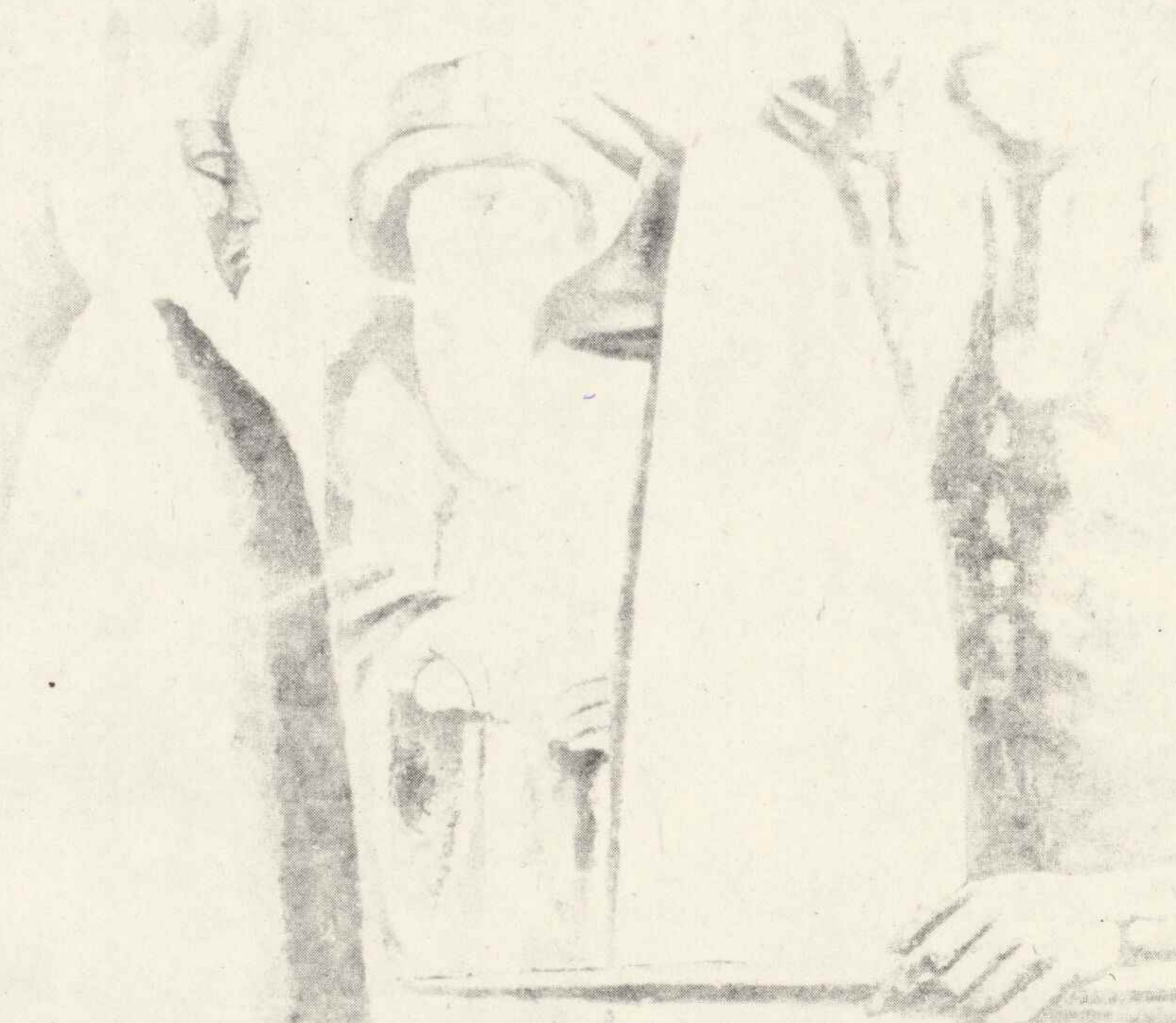
José Chavez Morado Postacie z pastorałki