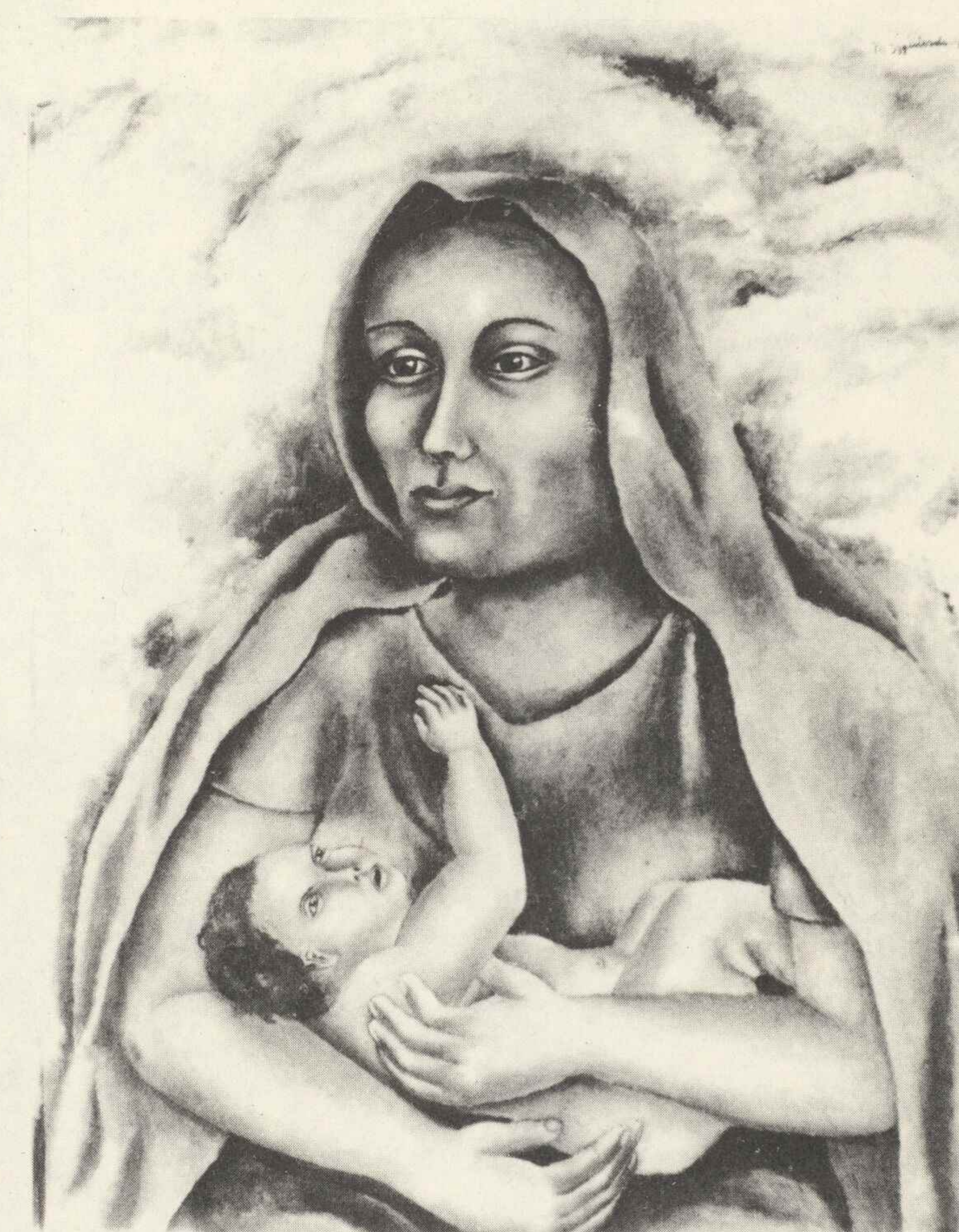
Maria Izoquierdo Macierzyństwo