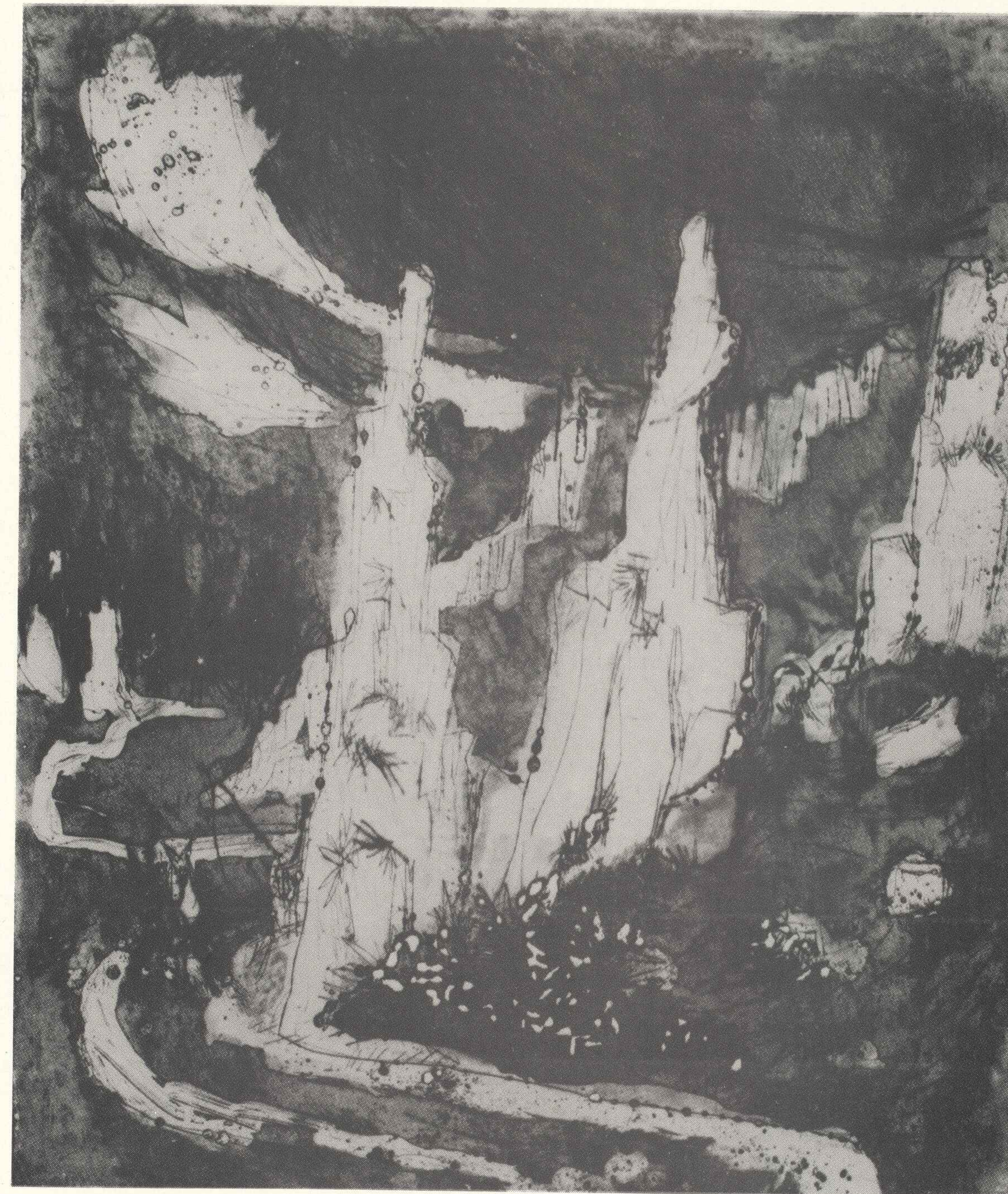
Kamienne panny, poz. kat. 2