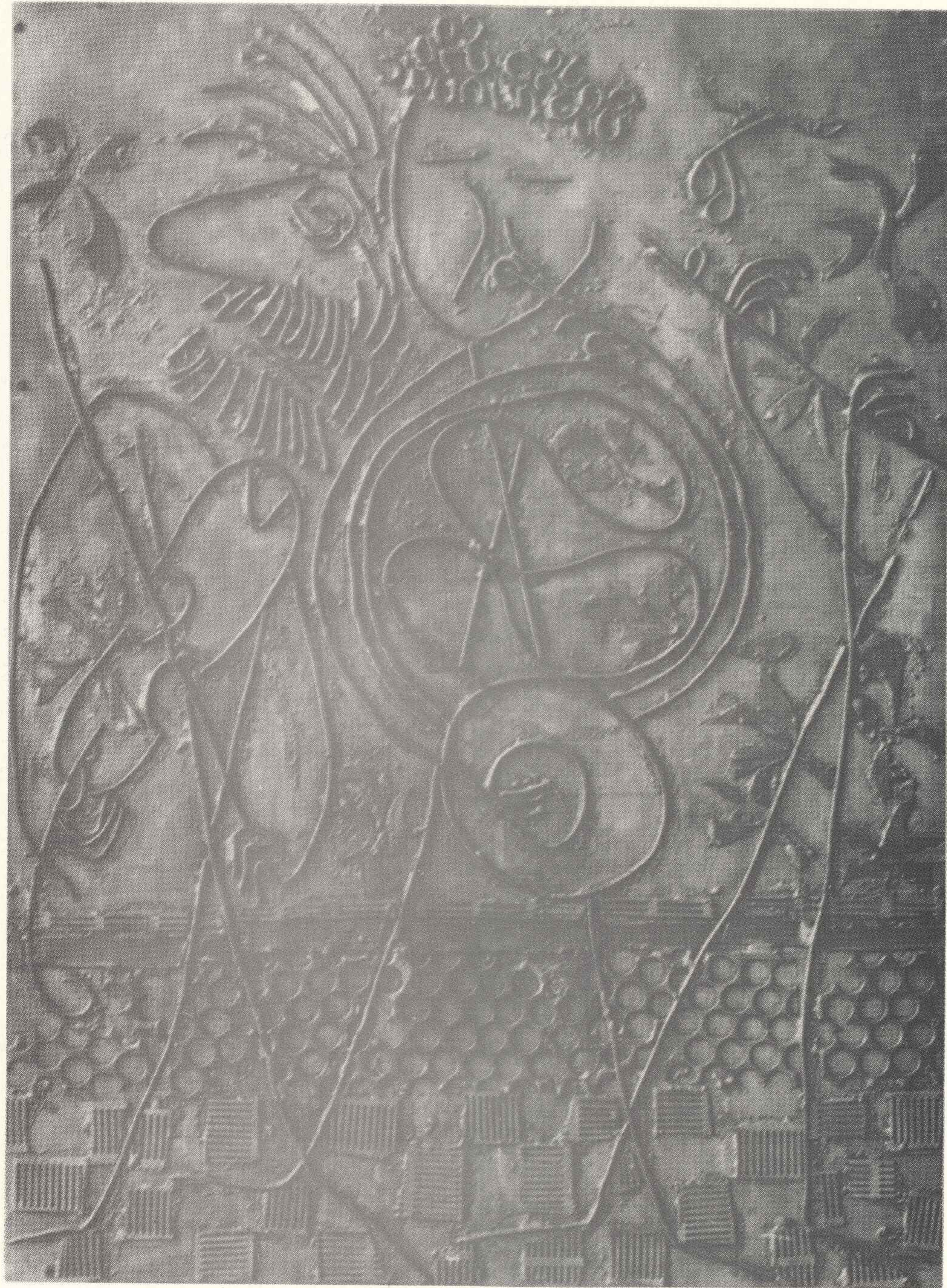
Trzej muzykanci, poz. kat. 44