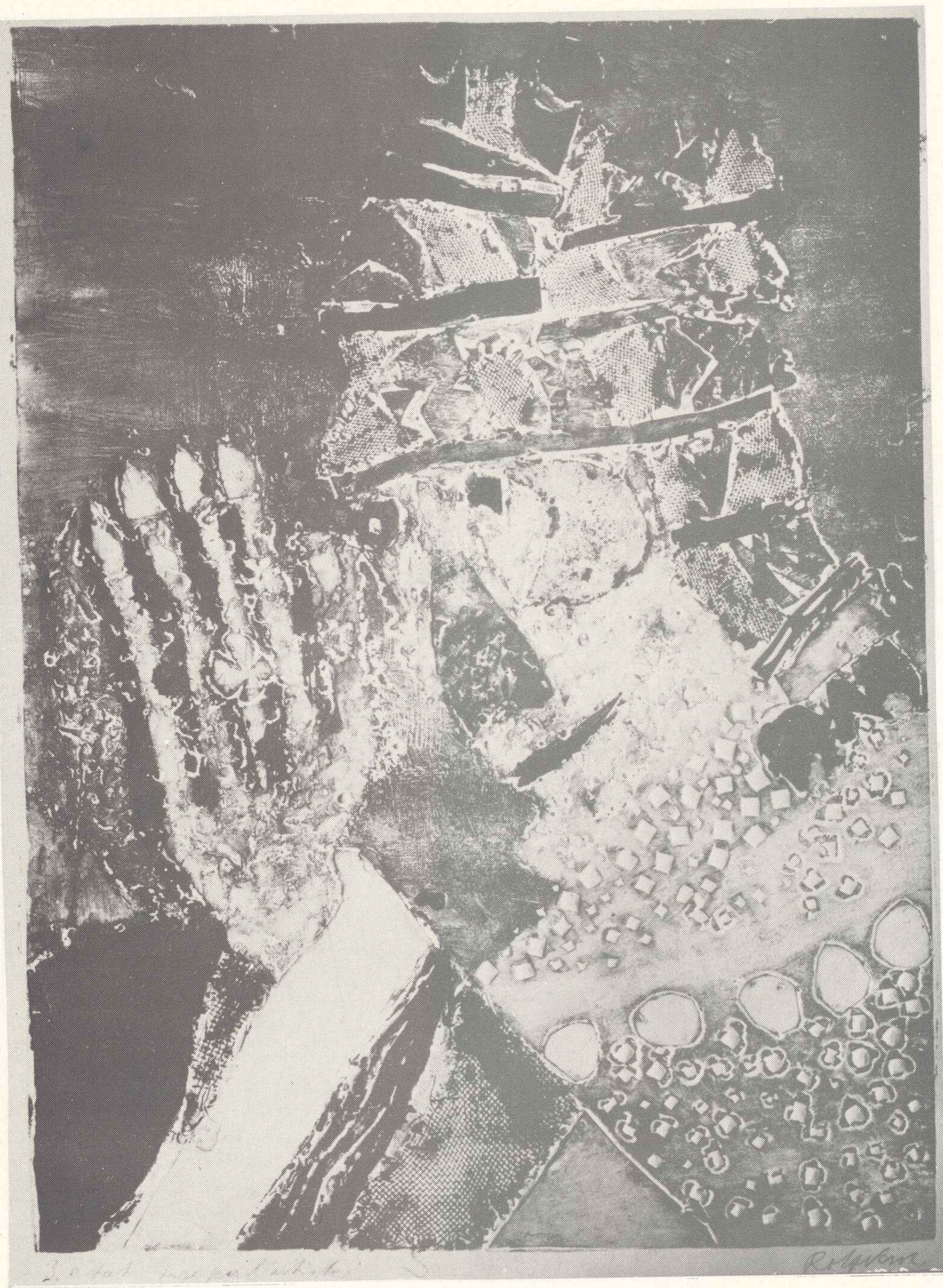
Biskup, poz. kat. 38