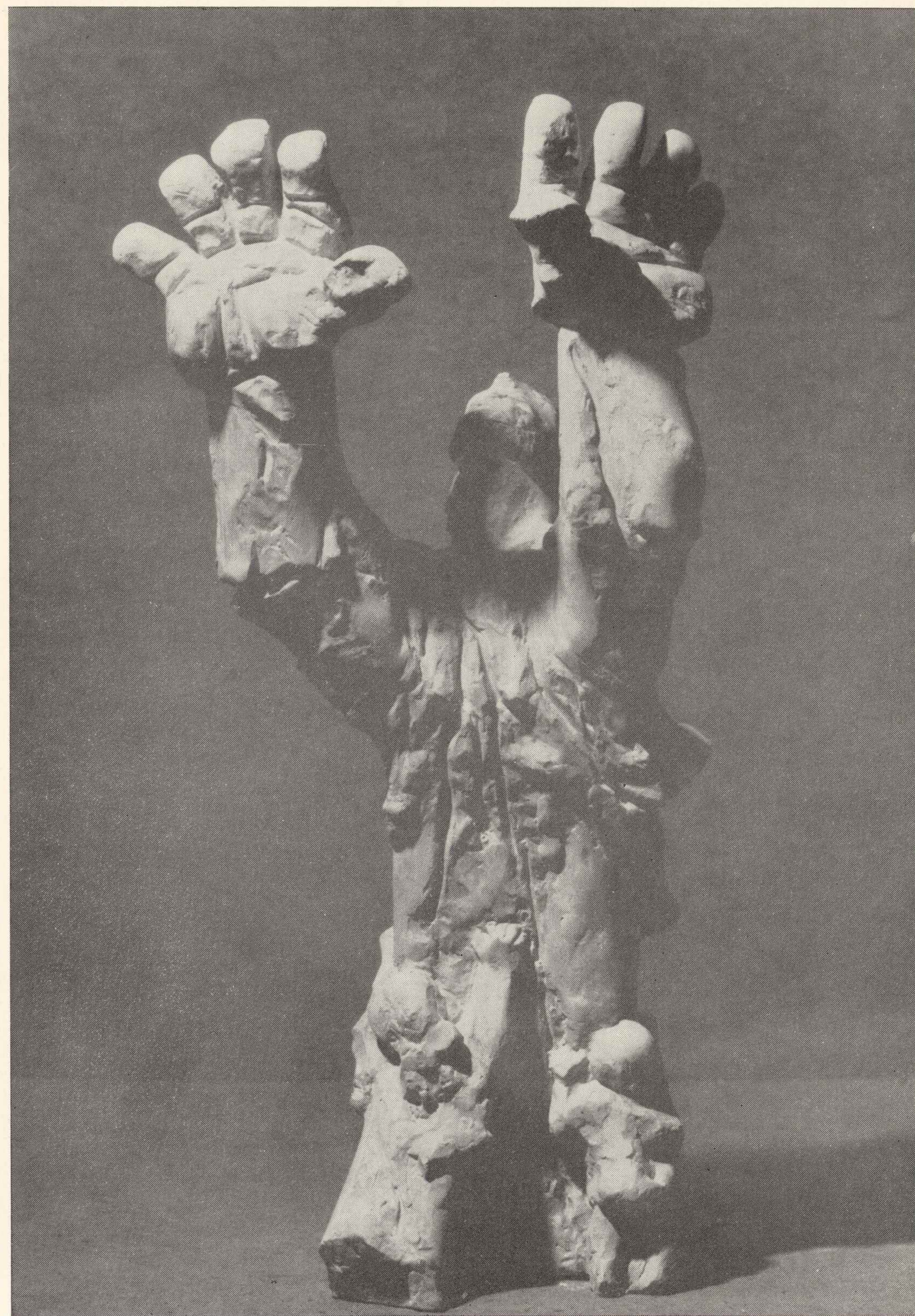
47. Przeciw przemocy