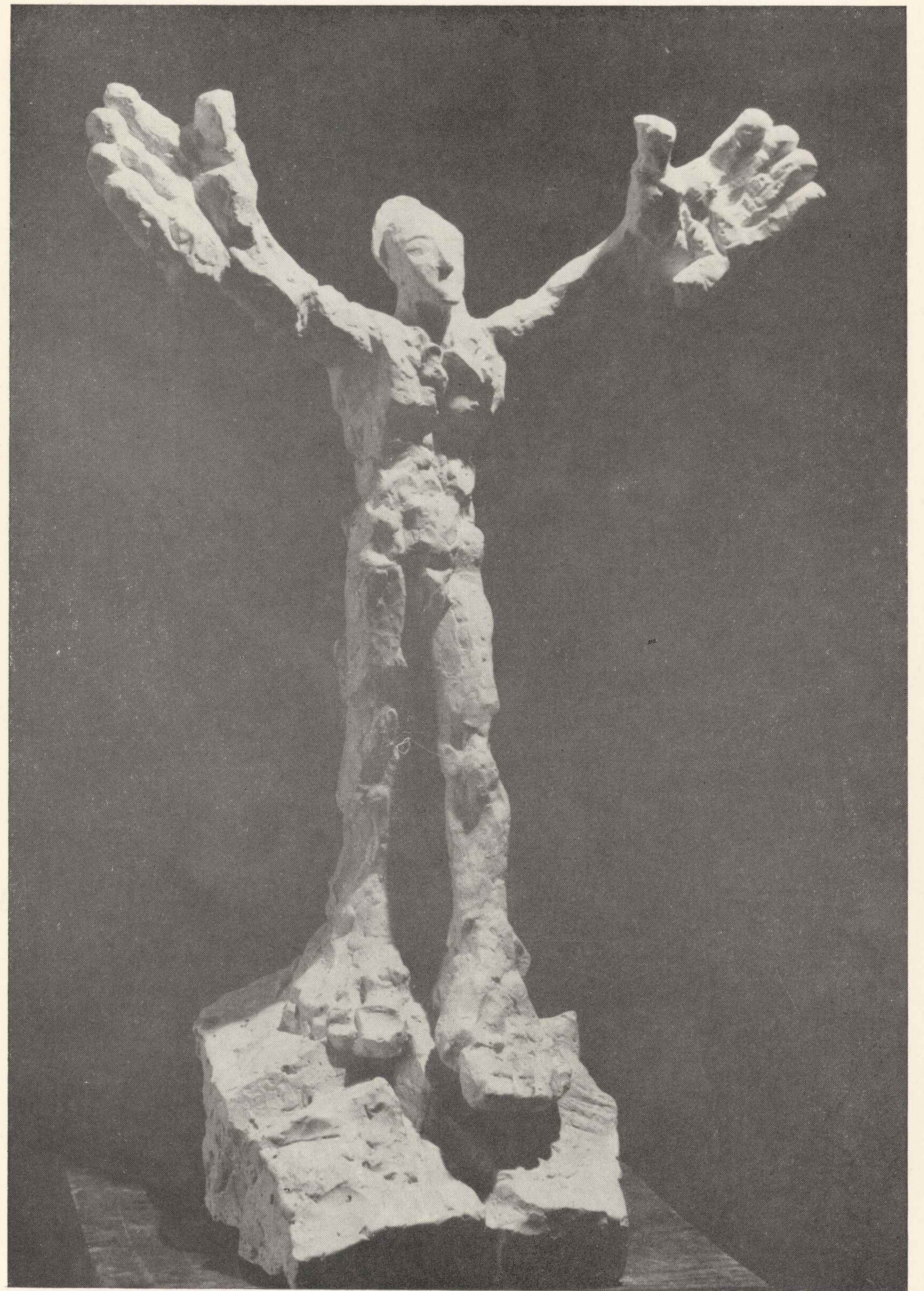
58. Człowiek II