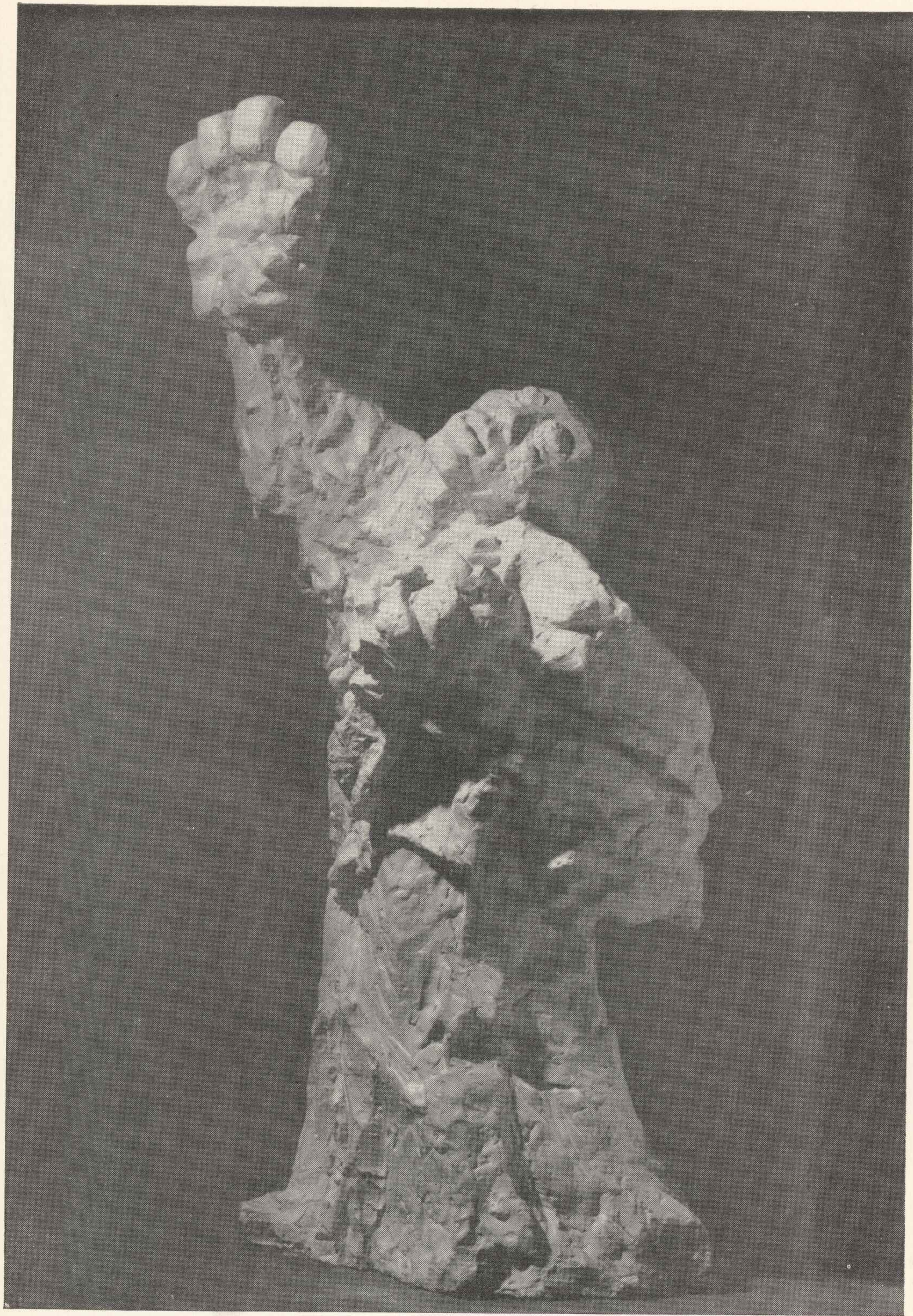
56. Protest matki II