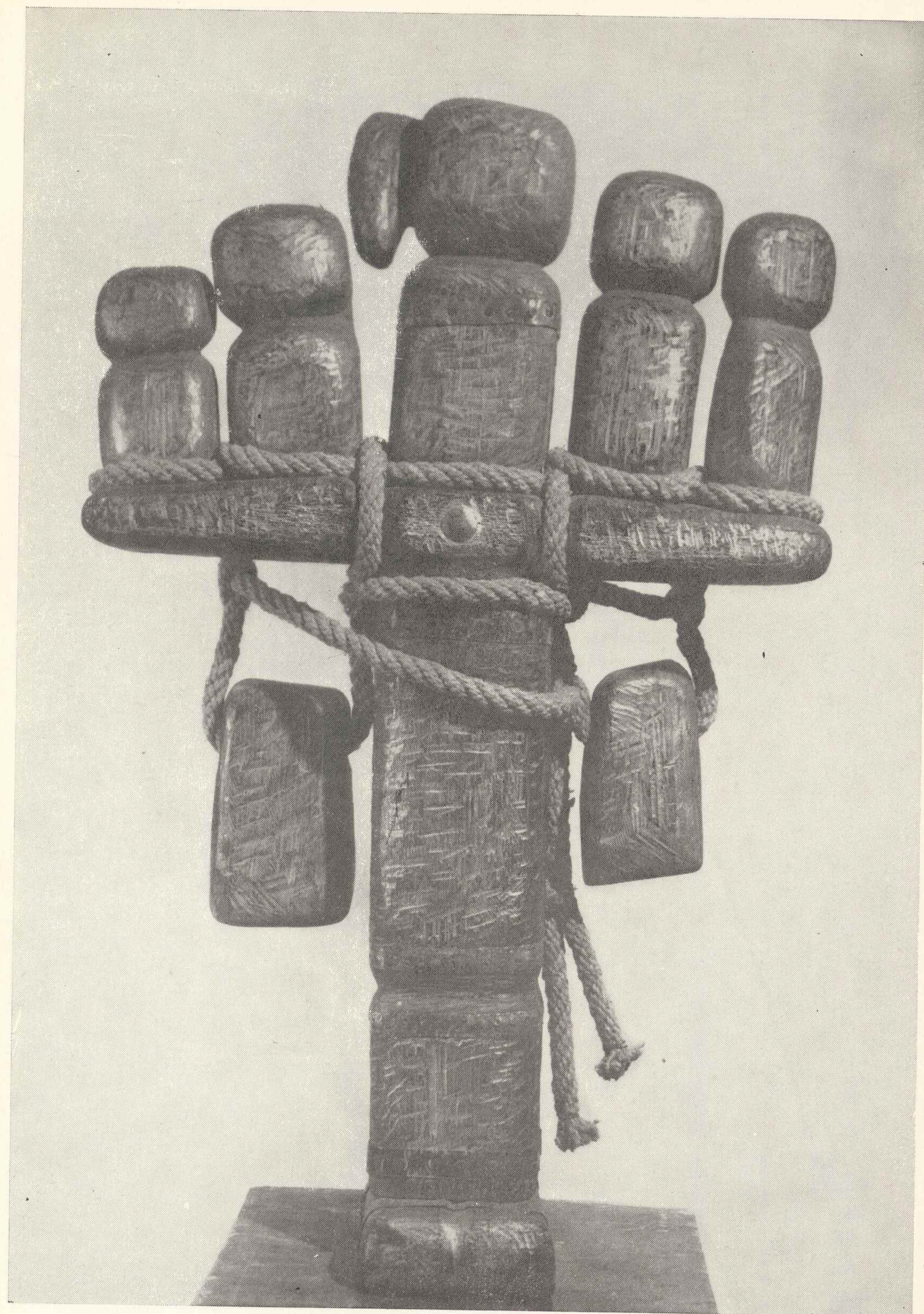
25. Opiekunka II