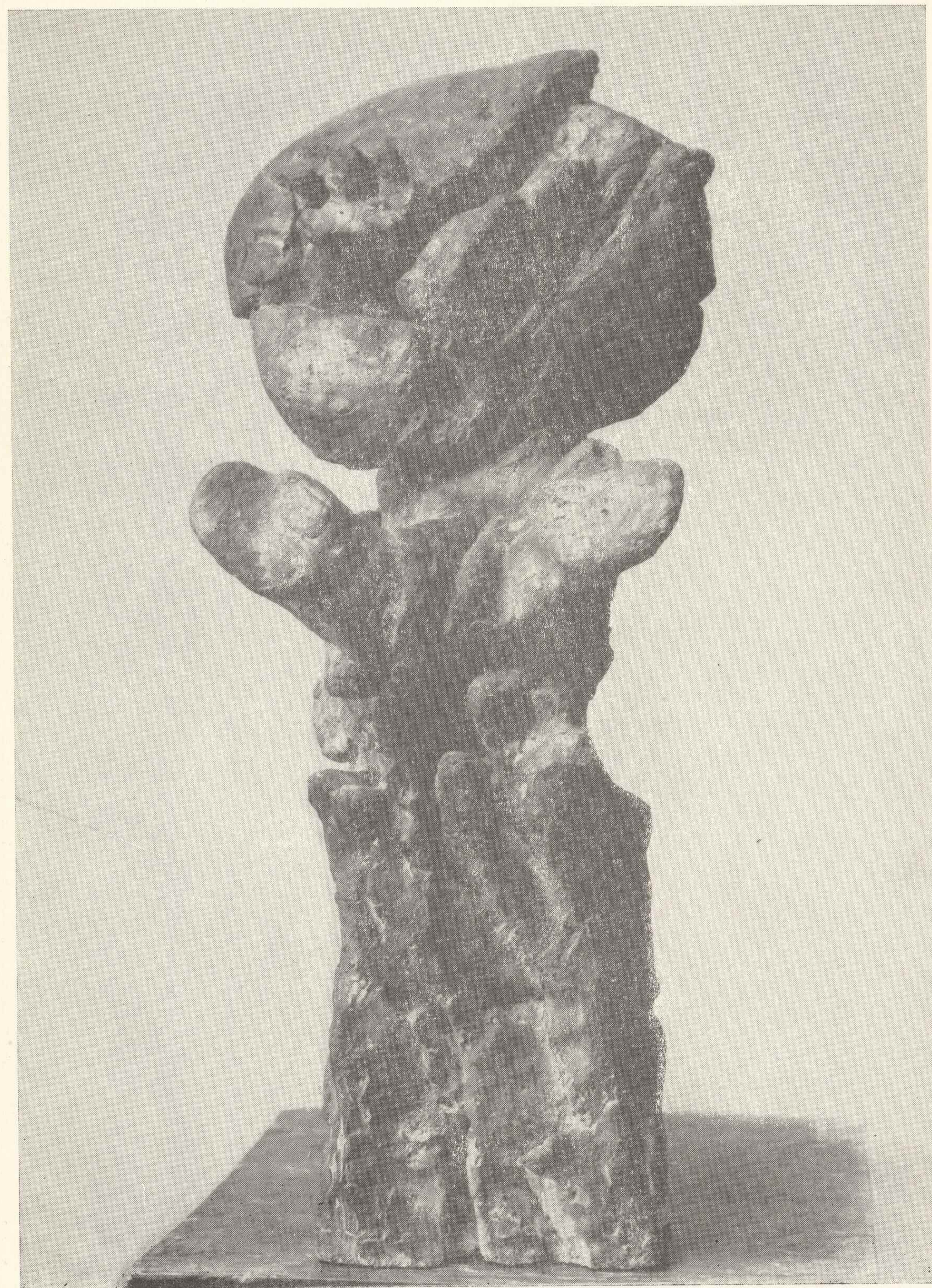
44. Zetłale dzieciństwo