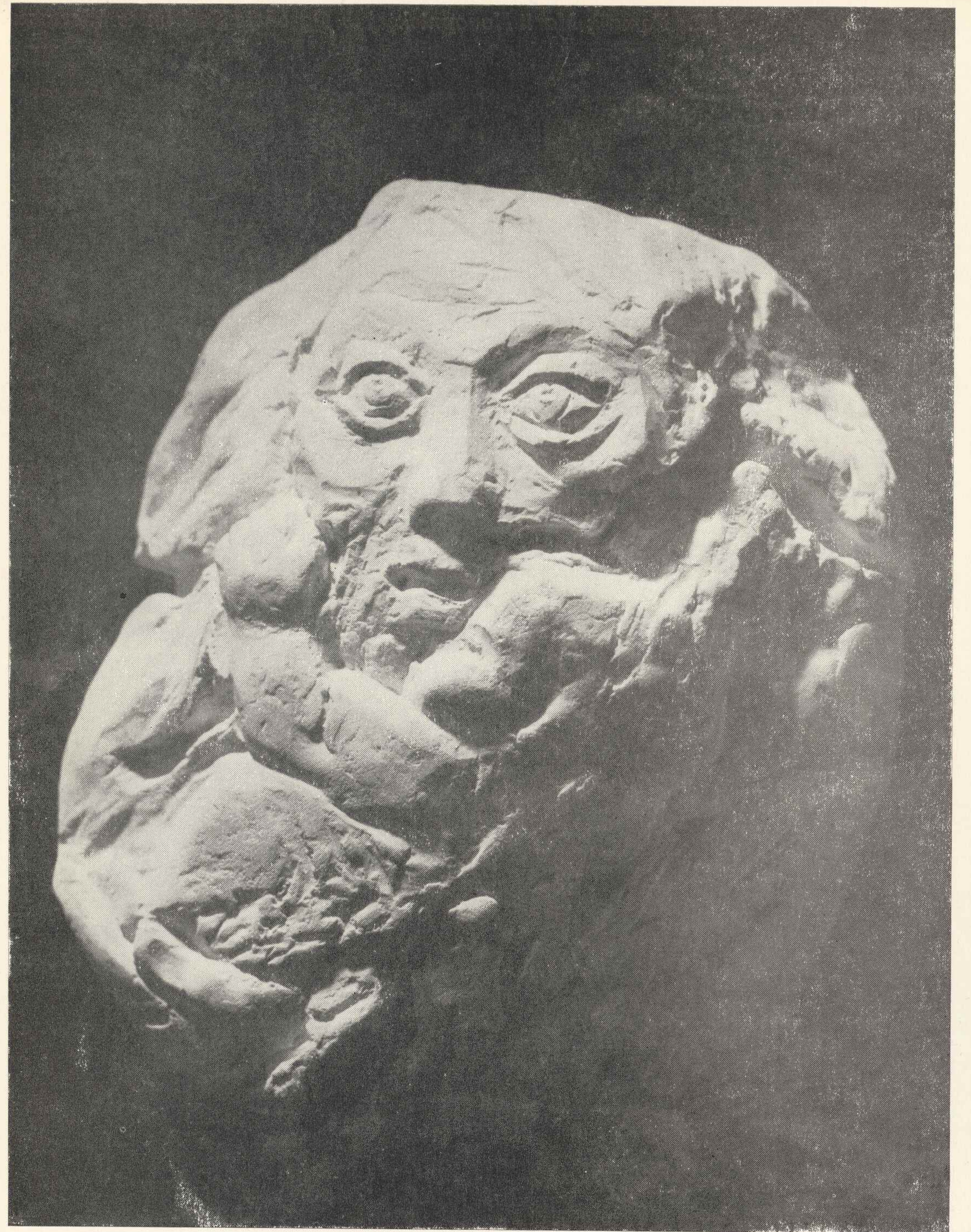
69. Groźne niebo (forma zbliżona do medalu)