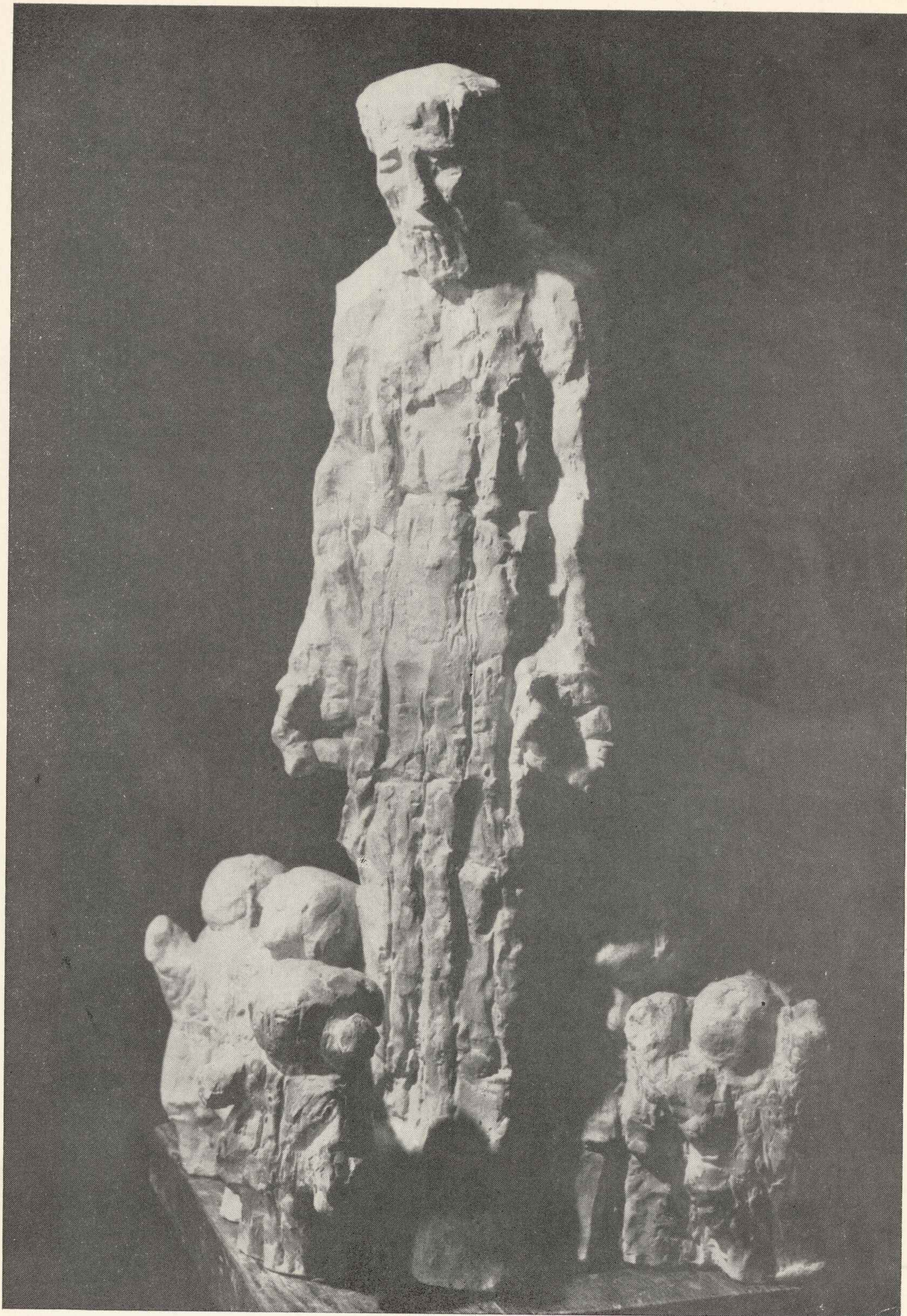
46. Janusz Korczak