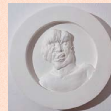
1. ARTUR MALEWSKI, WELTSCHMERZ , JOSEPH CARREY MERRICK, 2010, ZYWICA POLIESTROWA, 26 x 26 x 4 CM, KOLEKCJA ANNA I TOMASZ LUBIŃSKY

znany również jako człowiek-drzewo. Tryptyk ma formę ołtarza szafiastego. Artur Malewski ukazuje Weltschmerz , czyli odnosi się do pojęcia właściwego dla nie- mieckiego romantyzmu, które wynalazł Jean Paul, a z powodzeniem wykorzystał Johan Wolfgang Goethe w Cierpieniach młodego Wertera . Ból wynikający z absurdu świata nie prowadzi do buntu, lecz do apatii lub wręcz samobójstwa. Losy trzech postaci łączy wspólne uczucie do rzeczywistości, niewystarczającej, bo szczęście jest zawsze gdzie indziej. Jednocześnie tryptyk winduje dwa dziwołagi do rangi postaci branych za bóstwo, lub odwrotnie — przedmiot kultu sprowadza do po- ziomu kuriozum, którego miejsce jest w cyrku czy w muzeum historii naturalnej. Może być więc odebrany jako profanacja, przekroczenie nakazów stawianych