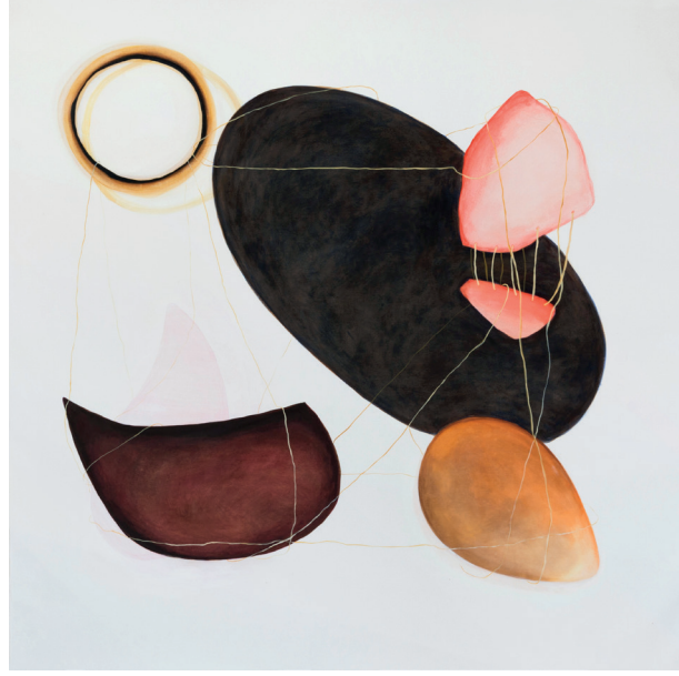
Organizm 95 / Organizm 87, 2015, olej, płótno / oil on canvas, 160 x 160 cm