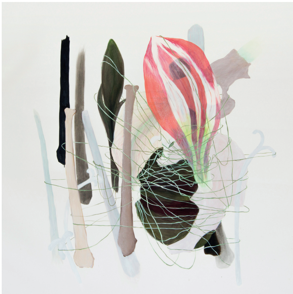
Organizm 88, 2015, olej na płótnie, 170 x 170 cm