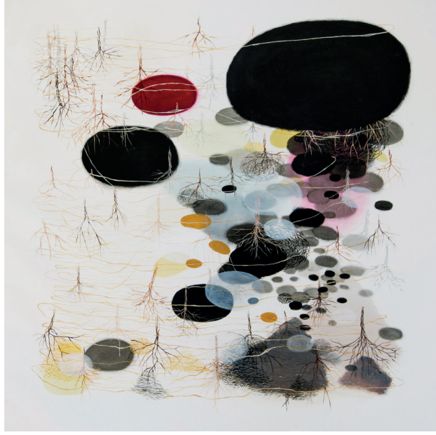
Organizm 97 (Suchy) / Organizm 97 (Dry), 2015, olej, płótno / oil on canvas, 160 x 160 cm