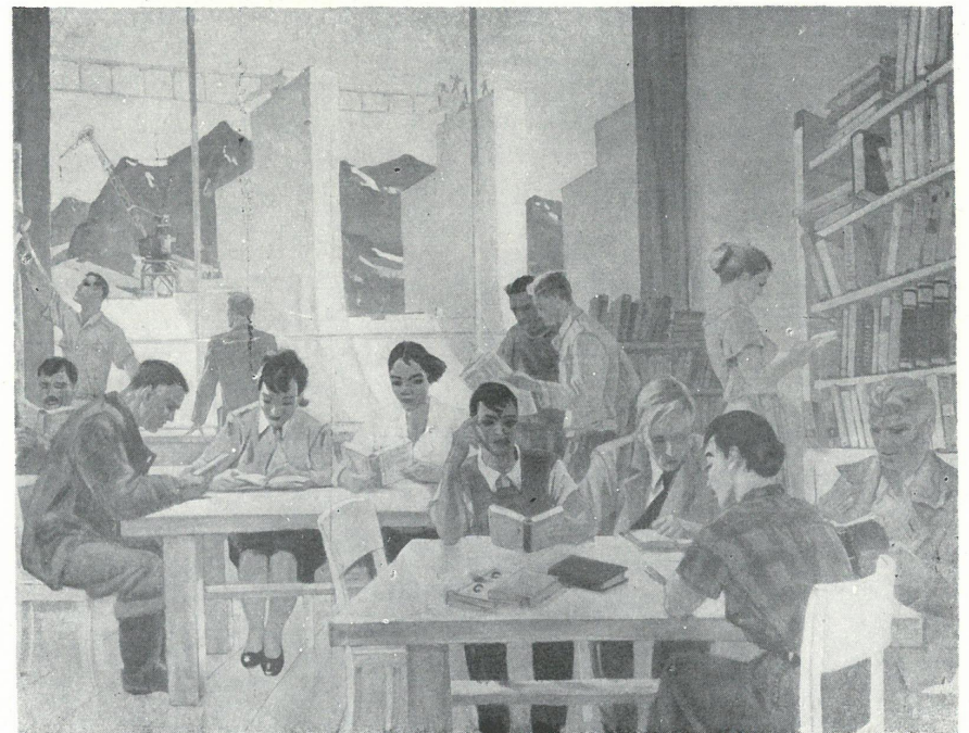
Nr kat. 6 Aleksander Dejneka, Nauka, olej