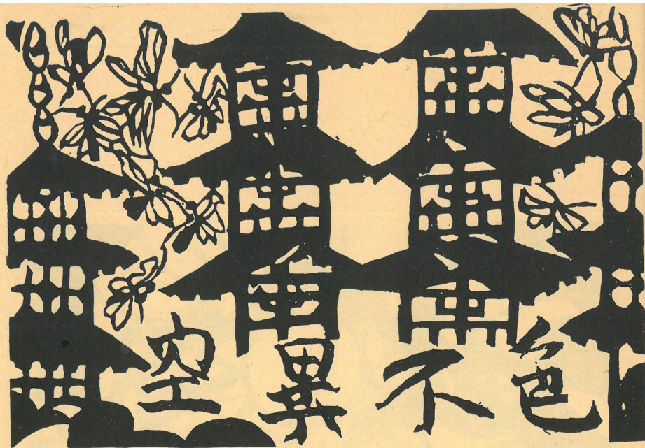
Z cyklu „Hannya Shingyo“, 1941

1952 — Zaprośzenie do zorganizowania wystawy w Salon de Mai w Paryżu. Wystawia po raz pierwszy swoje prace na Biennale w Sao Paulo. Otrzymuje Nagrodę na II Międzynarodowej Wystawie Drzeworytów w Lugano (Szwajcaria). Założenie Japońskiego Towarzystwa Drzeworytniczego. Wystawa indywidualna w Gallerie Willard w Nowym Jorku.