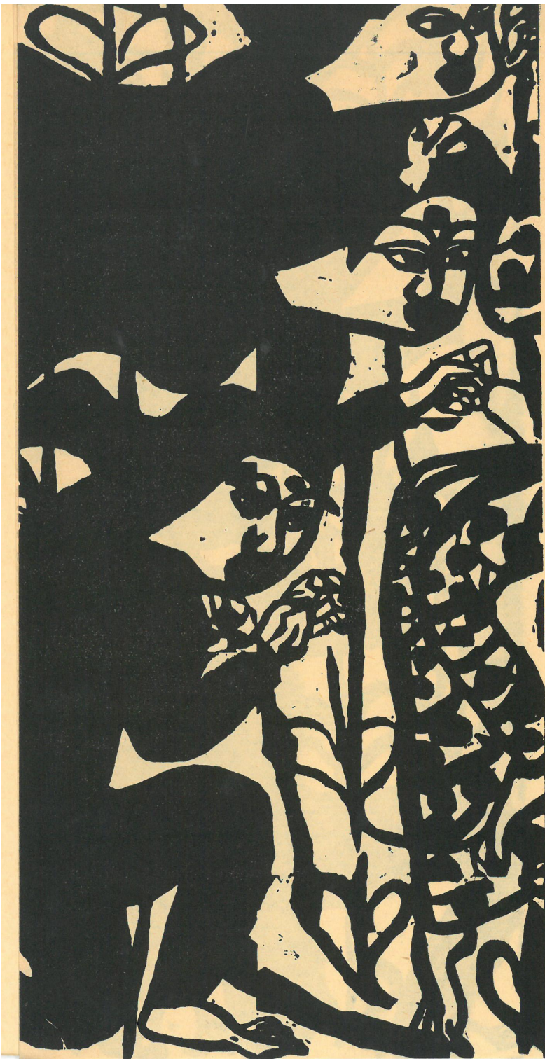
Z cyklu „Brama Demonów”, 1937