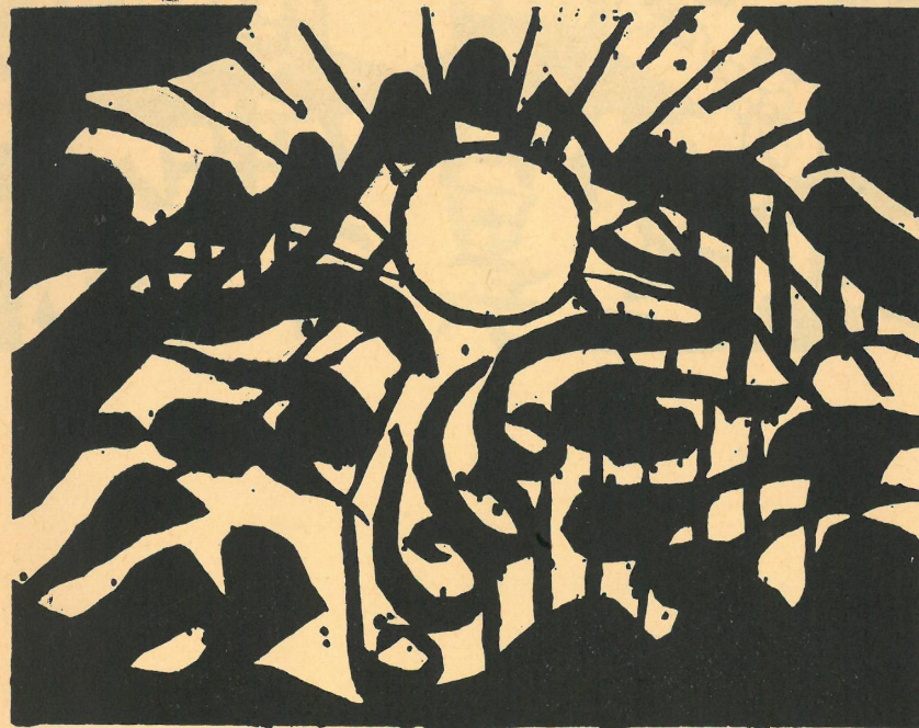
Z cyklu „Kegon Sutra”, 1937

1945 — Wydanie książki: Hankei. Wszystkie prawie dzieła drzeworytnicze zniszczone podczas bombardowania w dniu 25 maja.