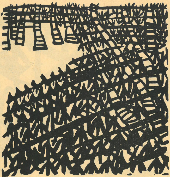
Z cyklu „Królestwo Kwiatów”, 1935

Projekt plakatu, opracowanie graficzne katalogu i projekt ekspozycji: Stanisław Zamecznik Drukarnia im Rewolucji Październikowej w Warszawie, zam. 374 S-8. Cena 8 zł