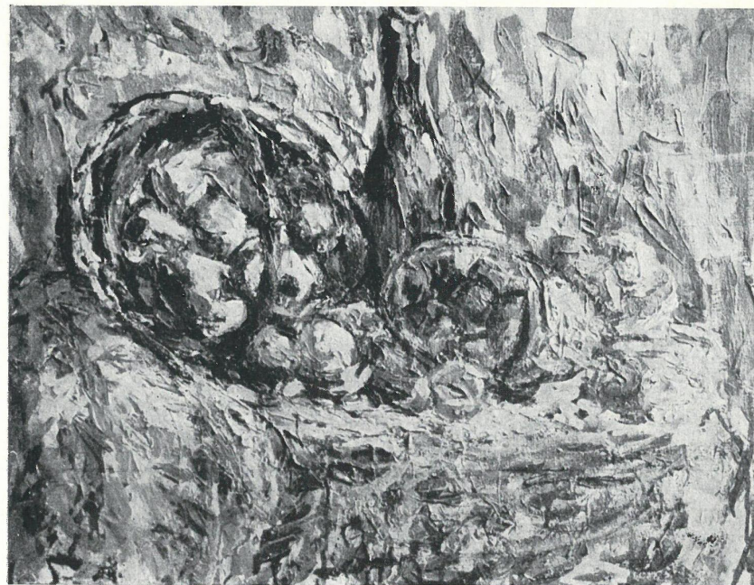
MARTWA NATURA Z BUTELKĄ, OLEJ