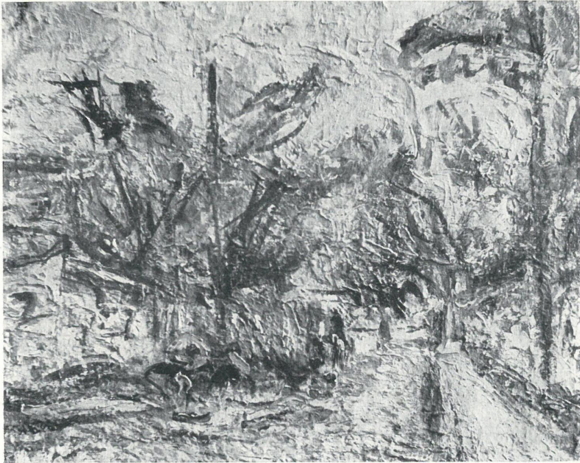
ULICA BASZTOWA W KAZIMIERZU, OLEJ