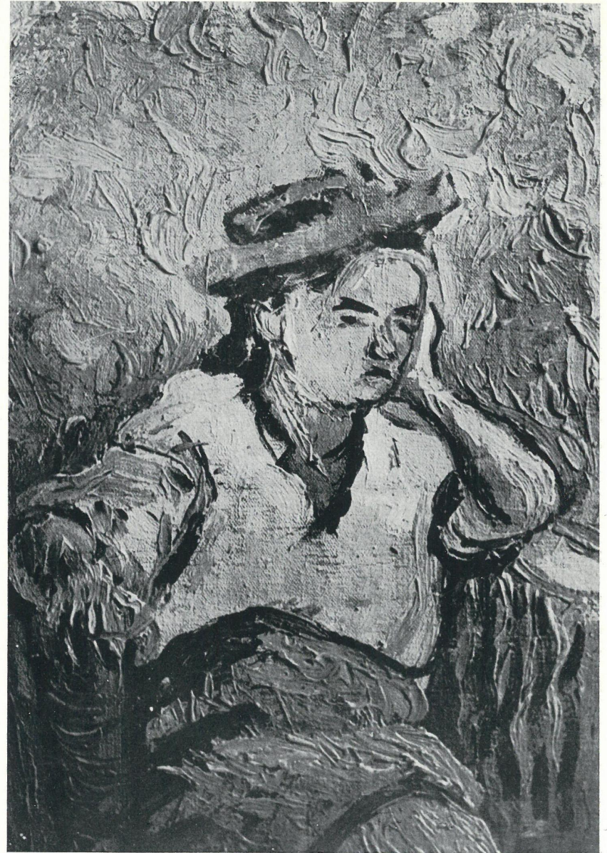
PORTRET W KAPELUSZU, OLEJ