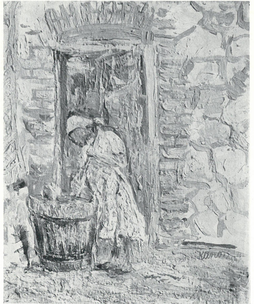
PRZY KADZI, OLEJ