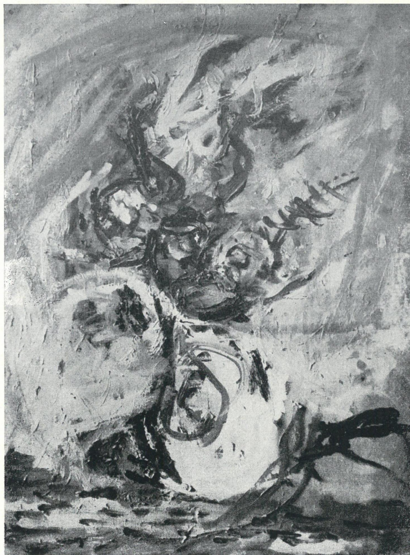
KWIATY Z BIAŁYM DZBANKIEM, OLEJ