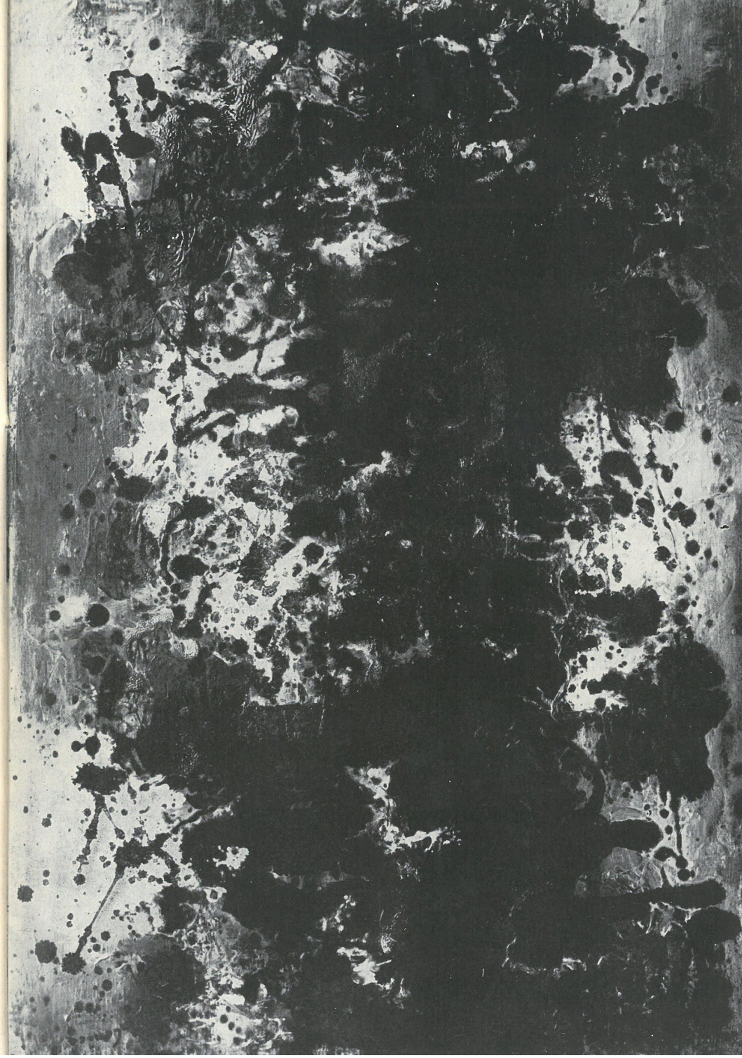
PORY ROKU (OBRAZ JESENNY), olej