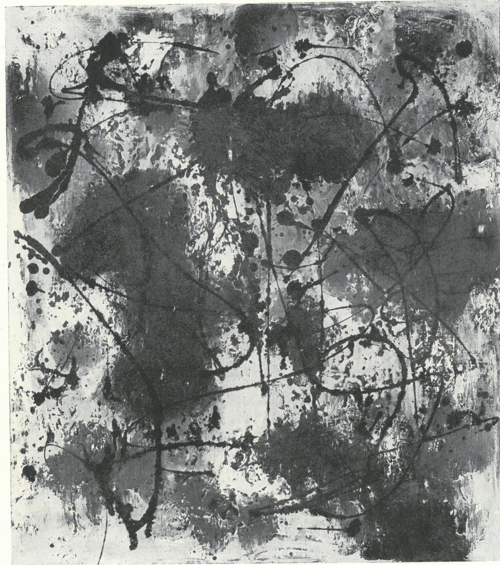
PLAMY NA ZIEMI I NIEBIE, olej