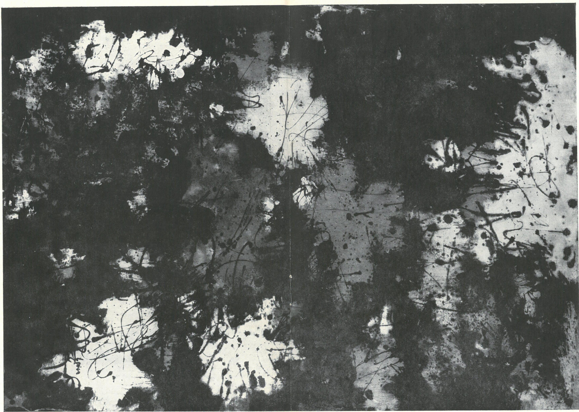
PLAMY NA ZIEMI I NIEBIE, olej