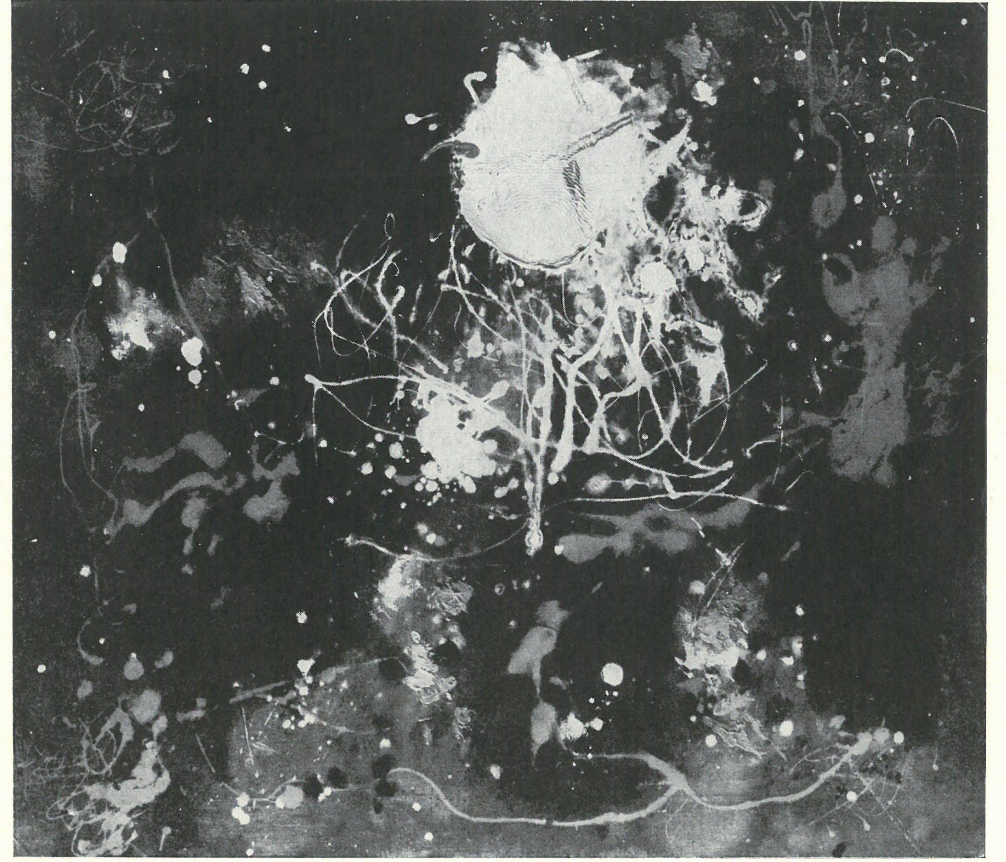
ZATRUCIE FARBĄ (LATO), olej