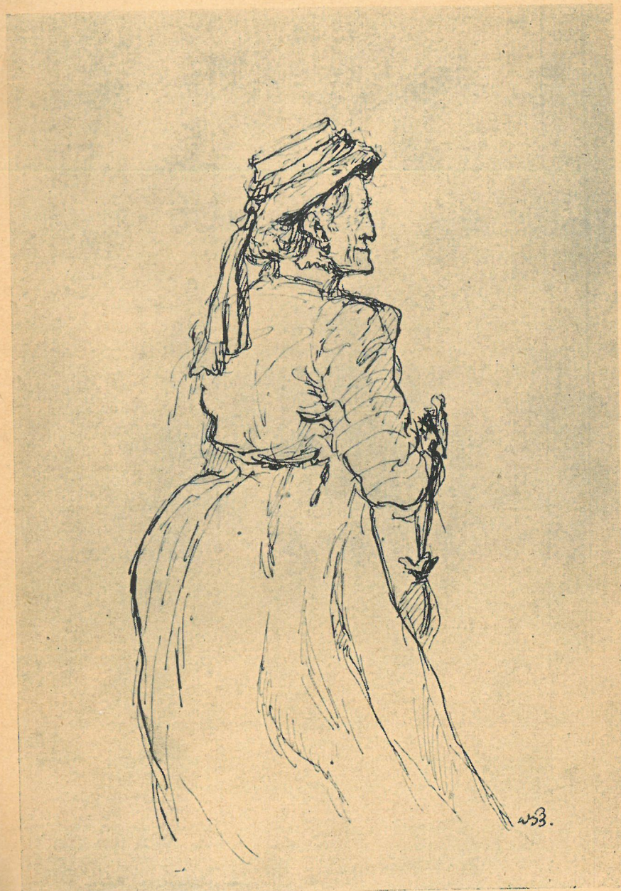
Z cyklu: Bohaterowie „Lalki” B. Prusa