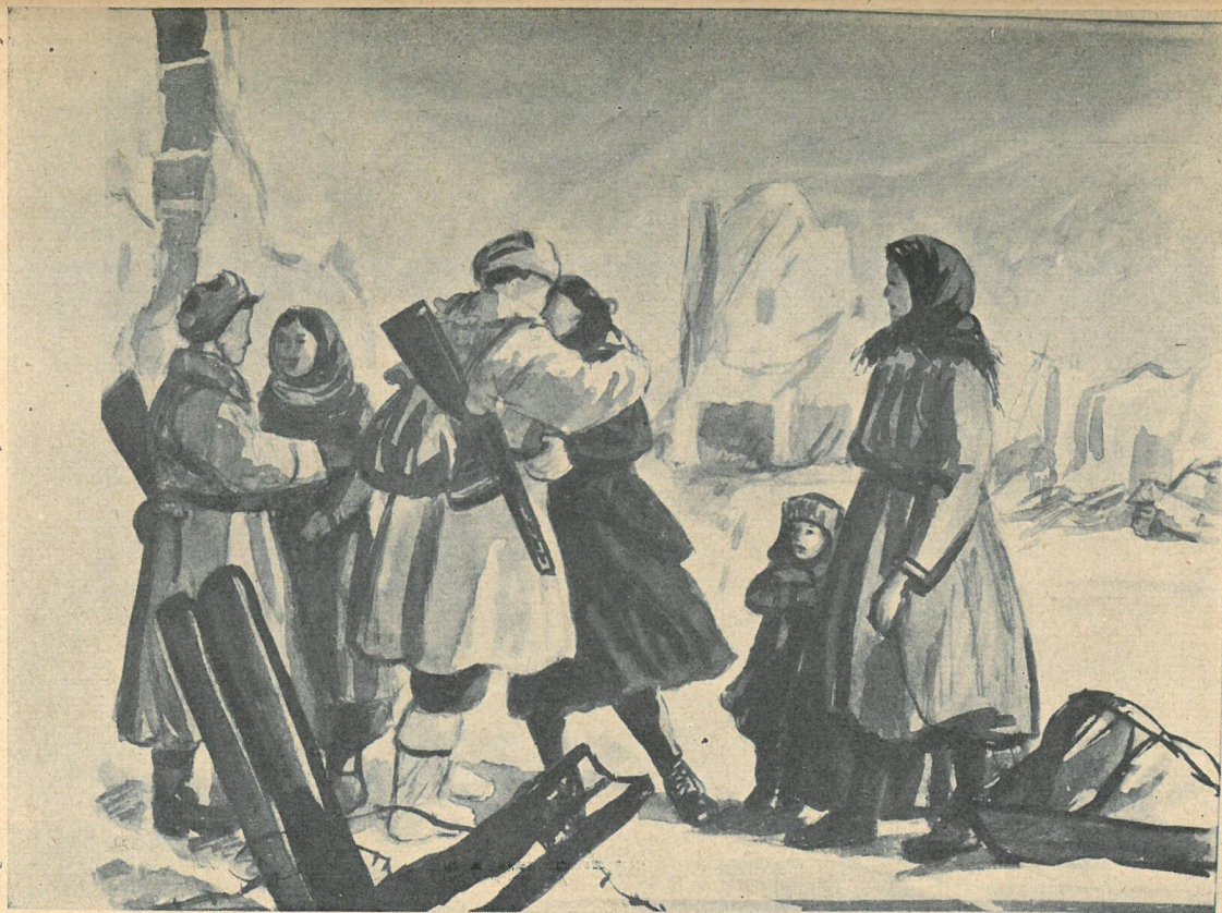
Z cyklu: „Dni Stalingradzkie”