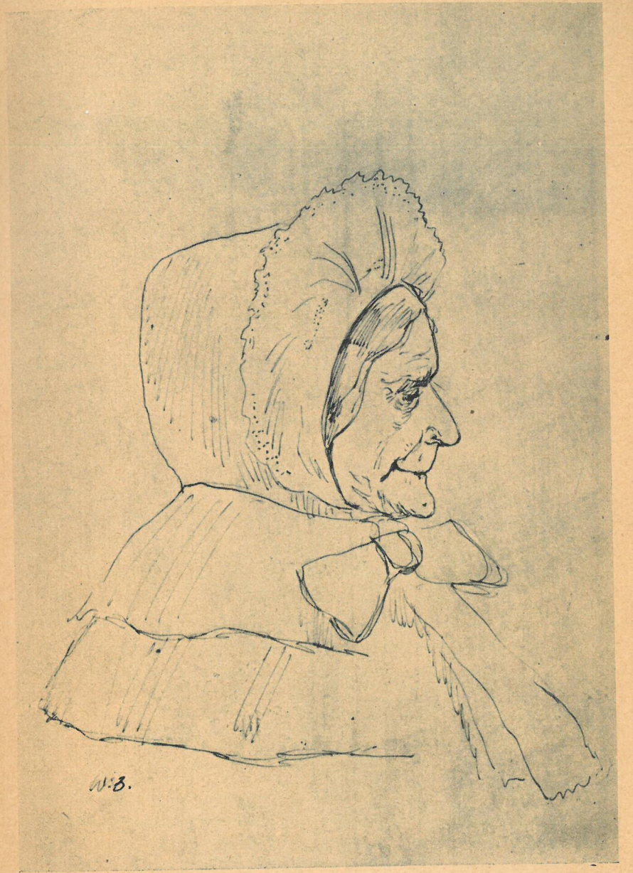
Z cyklu: Bohaterowie „Lalki” B. Prusa