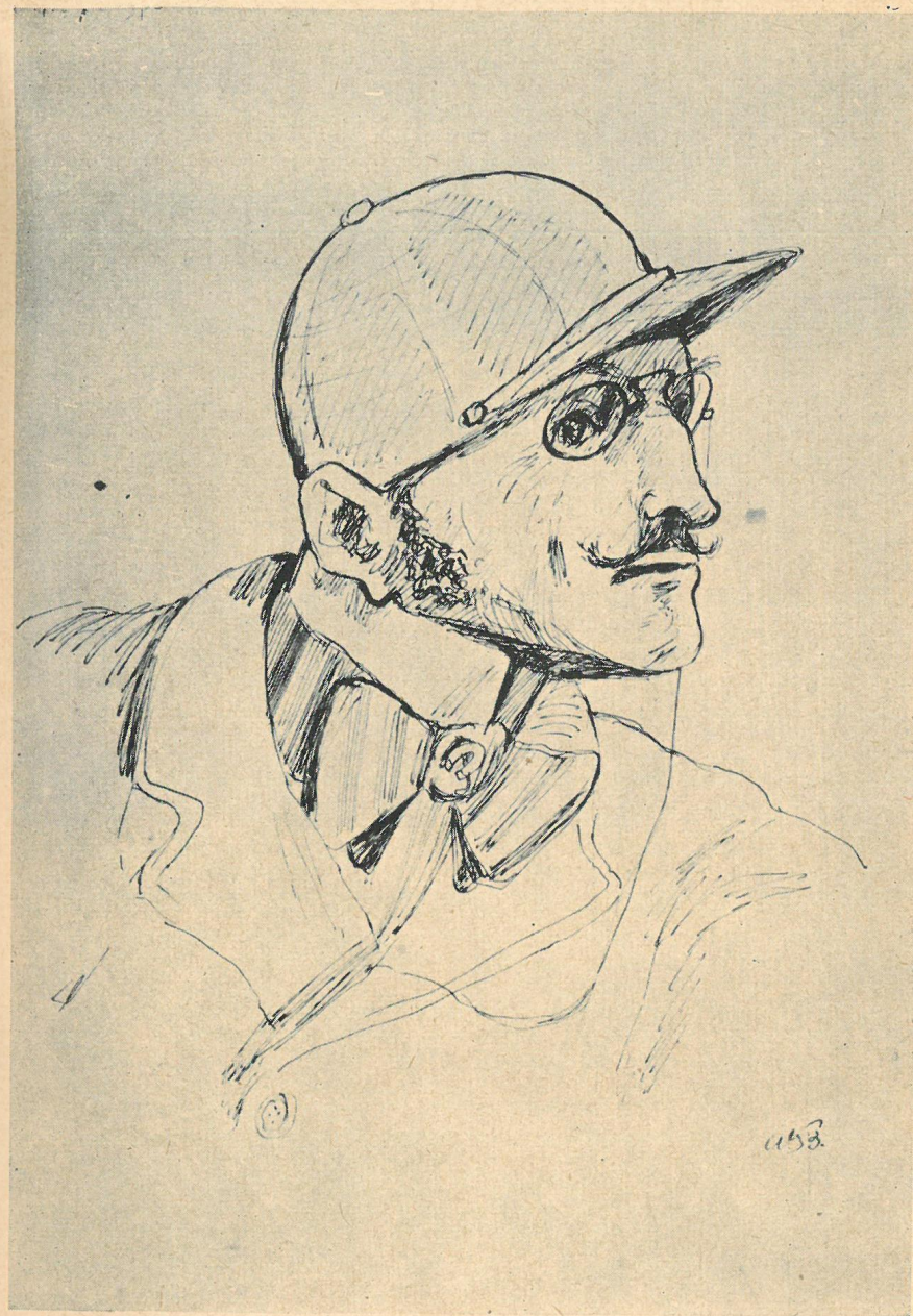
Z cyklu: Bohaterowie „Lalki” B. Prusa