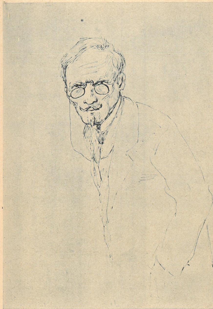
Z cyklu: Bohaterowie „Lalki” B. Prusa