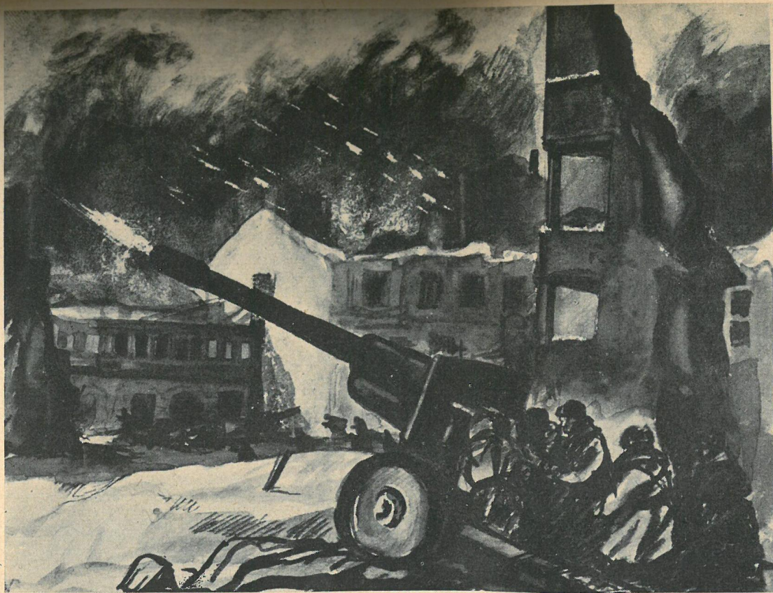
Z cyklu: „Dni Stalingradzkie”