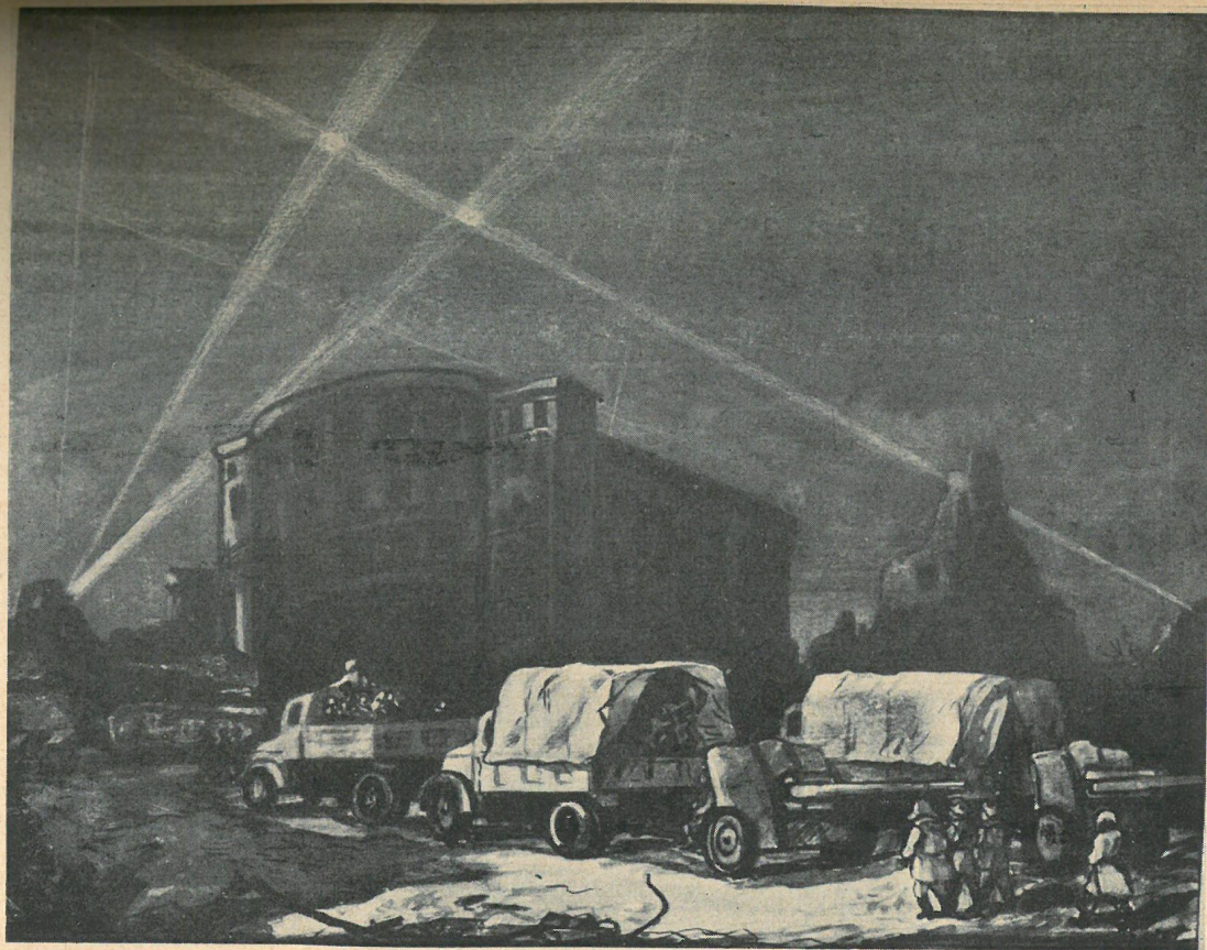
Z cyklu: „Dni Stalingradzkie”