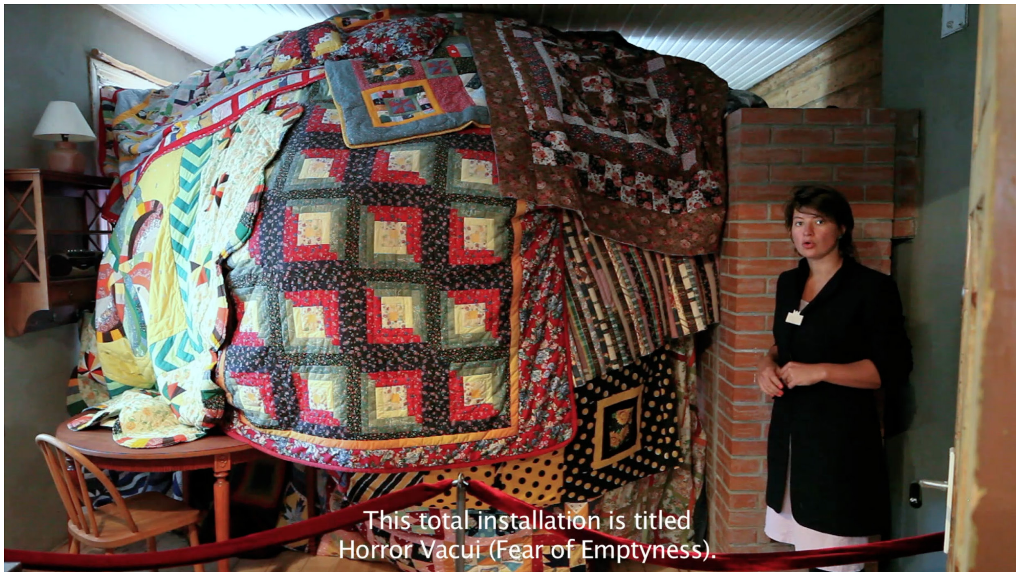
This total installation is titled Horror Vacui (Fear of Emptiness).