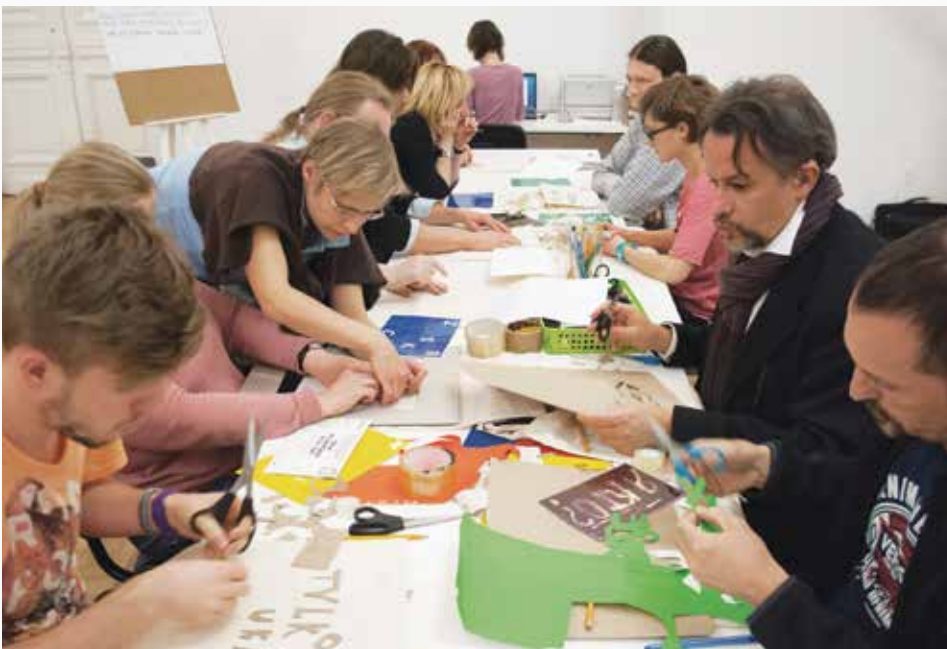
Warsztaty w Zachęcie