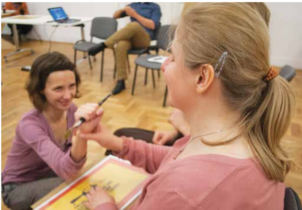
Warsztaty w Zachęcie, fot. A. Żurawska