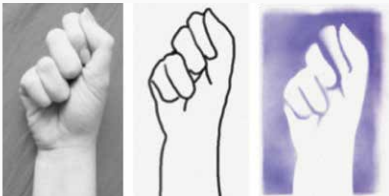
Etapy powstawania szablonu dłoni

ZAMIAST KOMPUTEROWEJ OBRÓBKII GRAFICZNEJ MOŻNA TEŻ OBRYSOWAĆ KONTUR I ZAZNACZYĆ LINIE WYCIĘCIA BEZPOŚREDNIO NA WYDRUKU ZDJĘCIA NA KARTCE A4