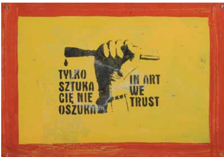
Paweł Jarodzki, Tylko sztuka cię nie oszuka , 2006, fot. J. Gładycowski, kolekcja Zachęty – Narodowej Galerii Sztuki

WAŻNE! DLA OSÓB WIDZĄCYCH OBRAZ NIE POWINIEN BYĆ EKSPONOWANY WCZEŚNIEJ NIŻ PO DRUGIM ZADANIU.