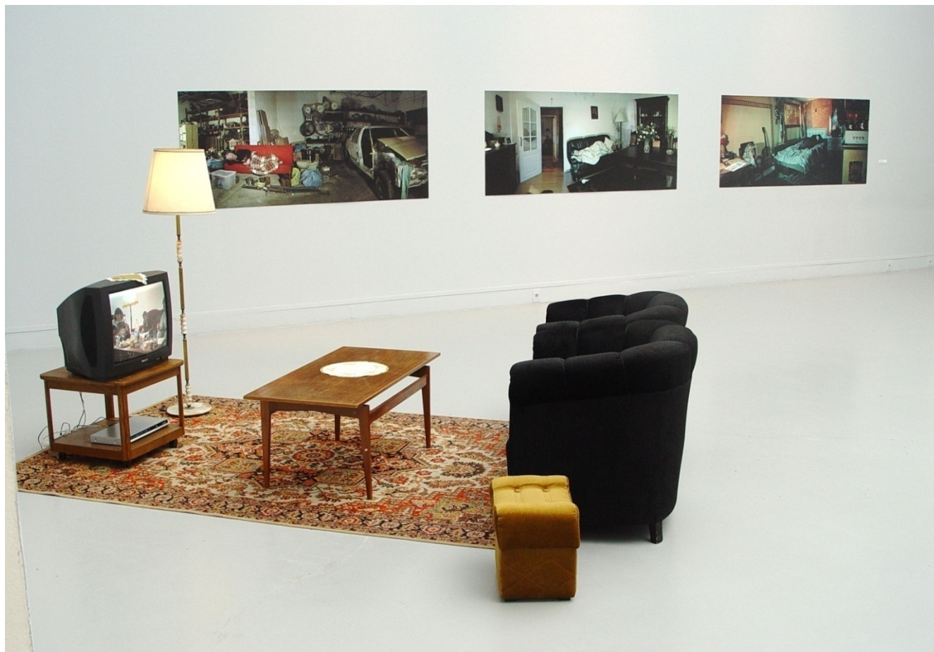
Grupa Azorro, Rodzina