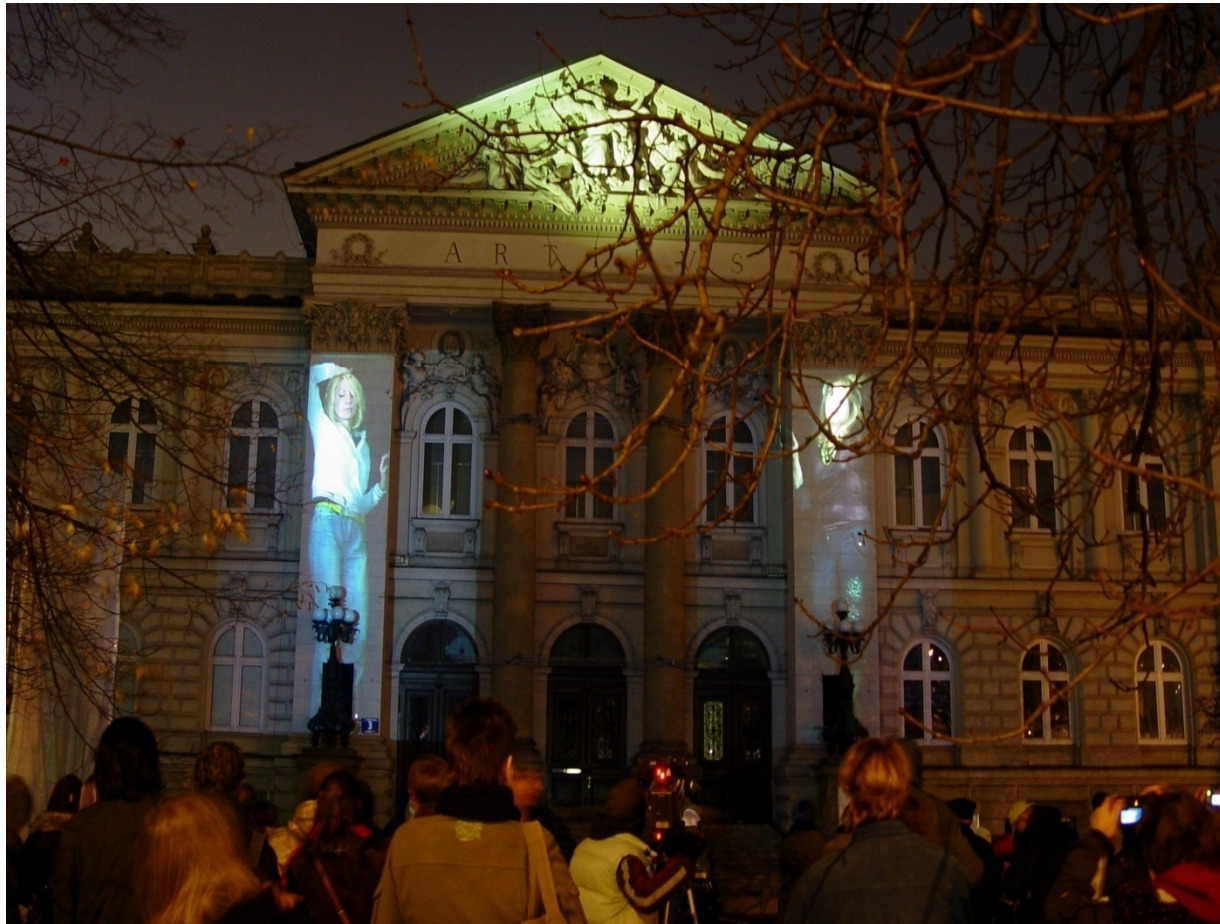
To Sztuka! Puka, 2012