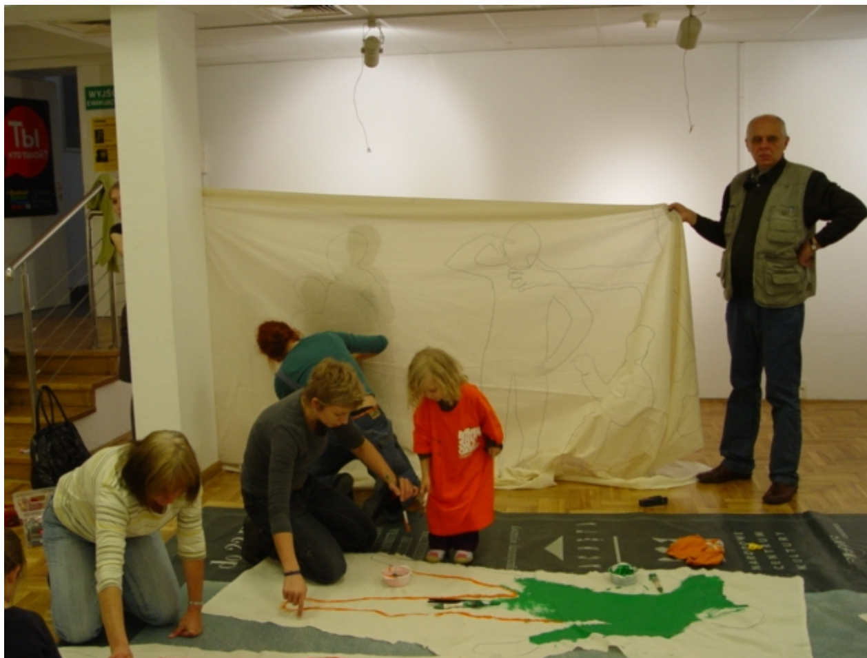
To Sztuka! Puka, 2012