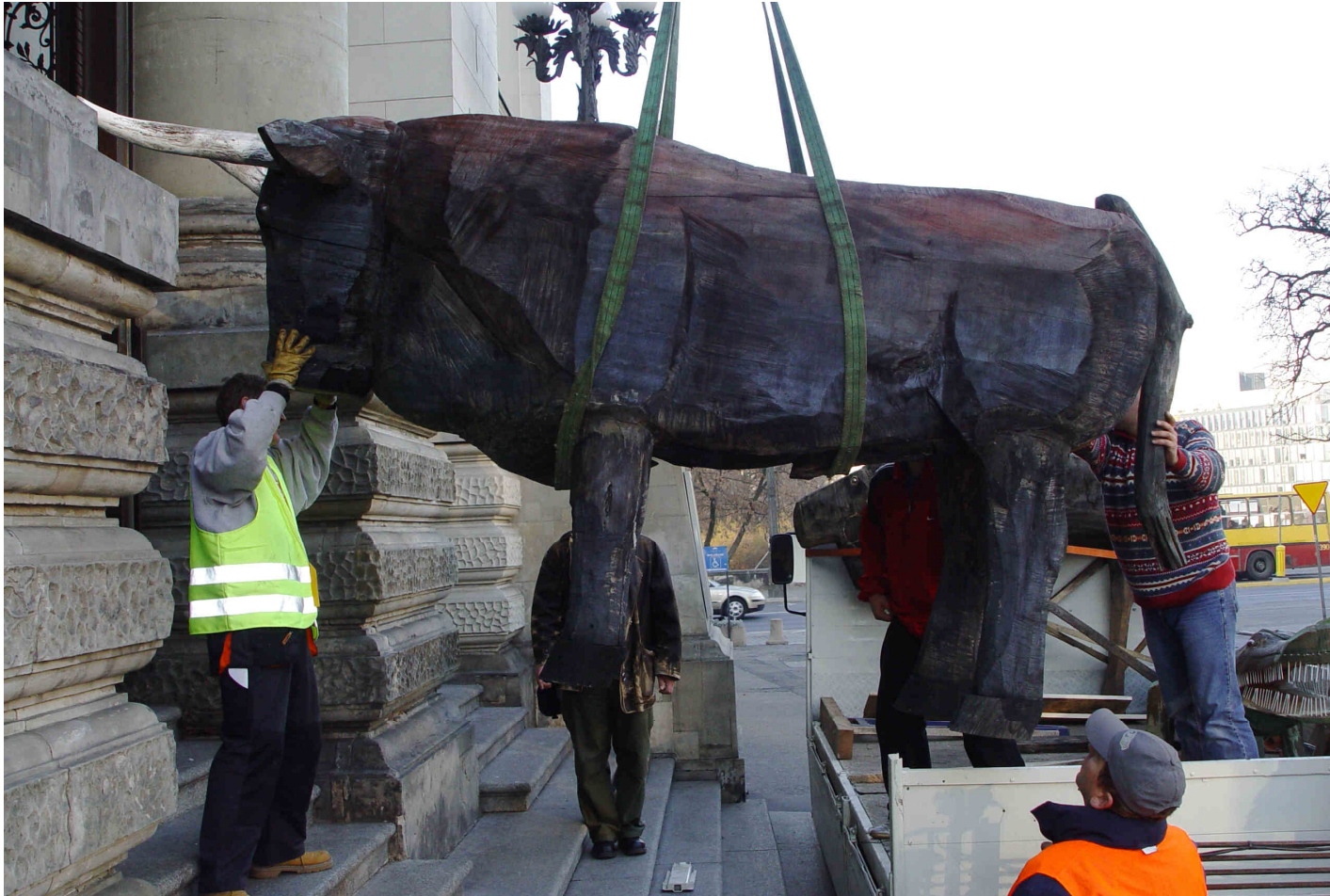
To Sztuka! Puka, 2012