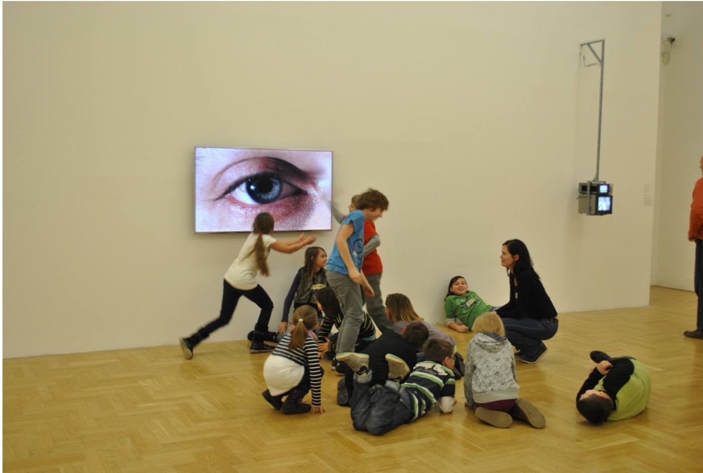
To Sztuka! Puka, 2012