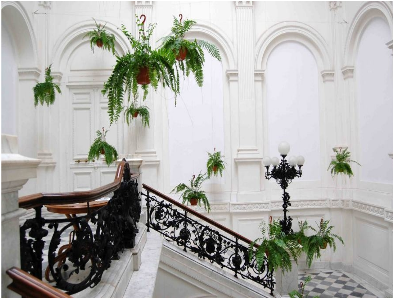
To Sztuka! Puka, 2012