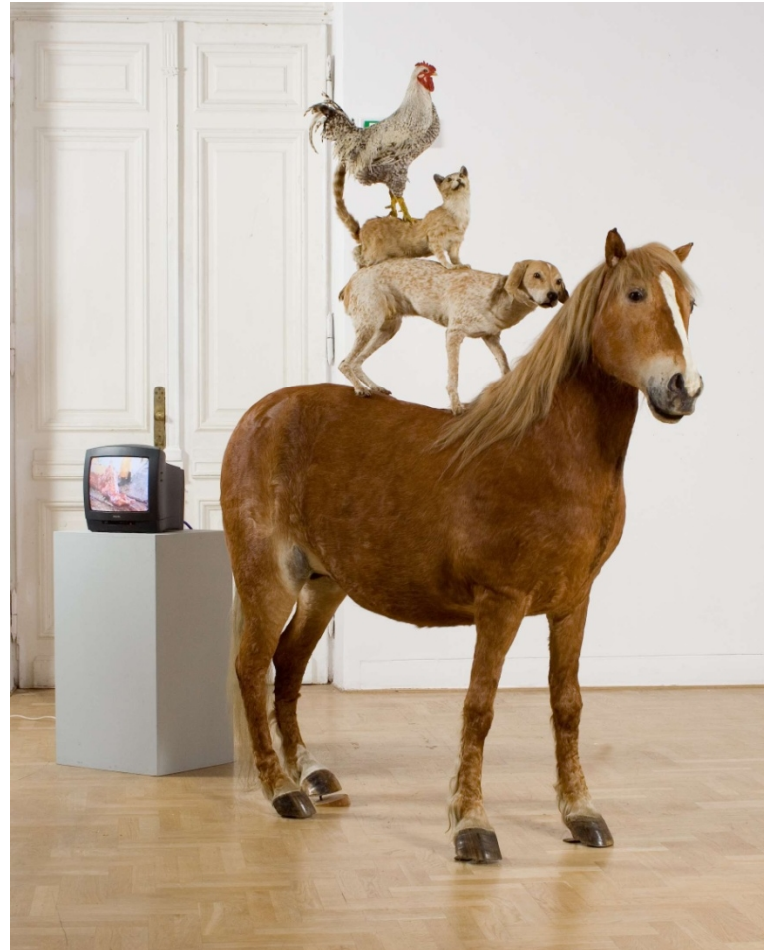
To Sztuka! Puka, 2012