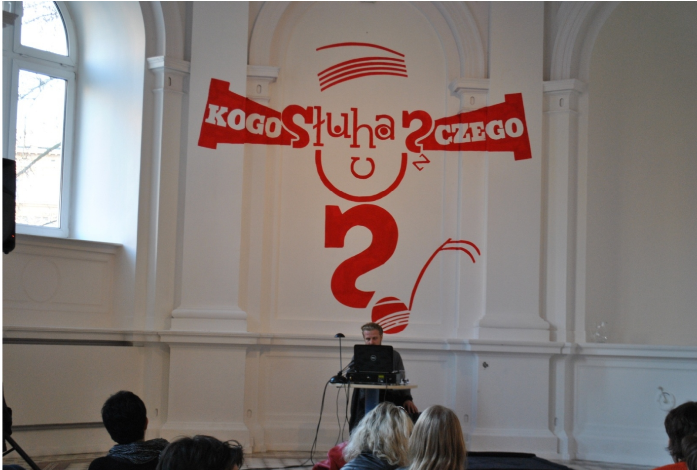
To Sztuka! Puka, 2012