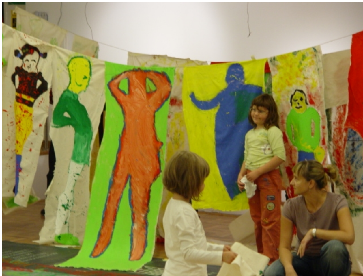
To Sztuka! Puka, 2012