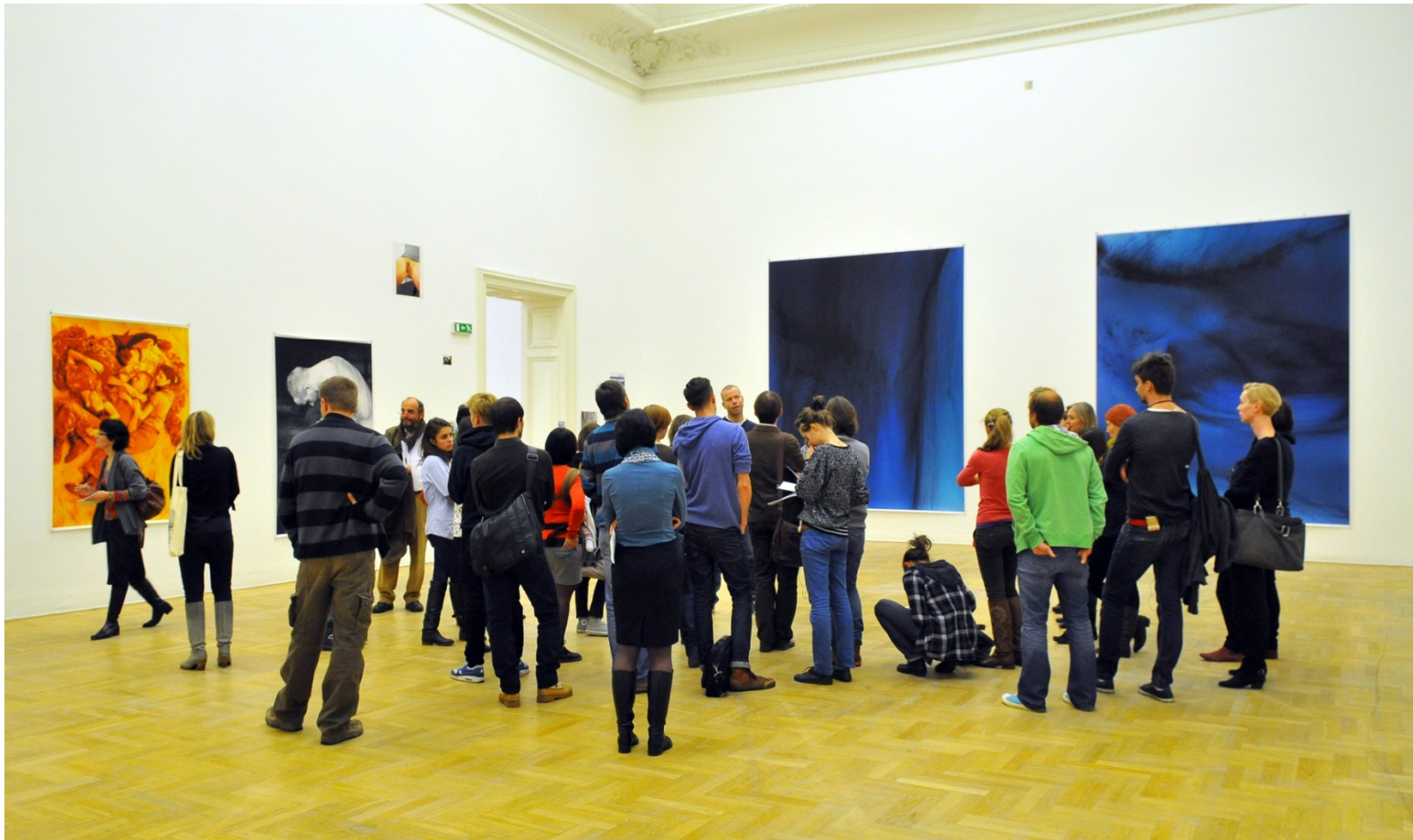
To Sztuka! Puka, 2012