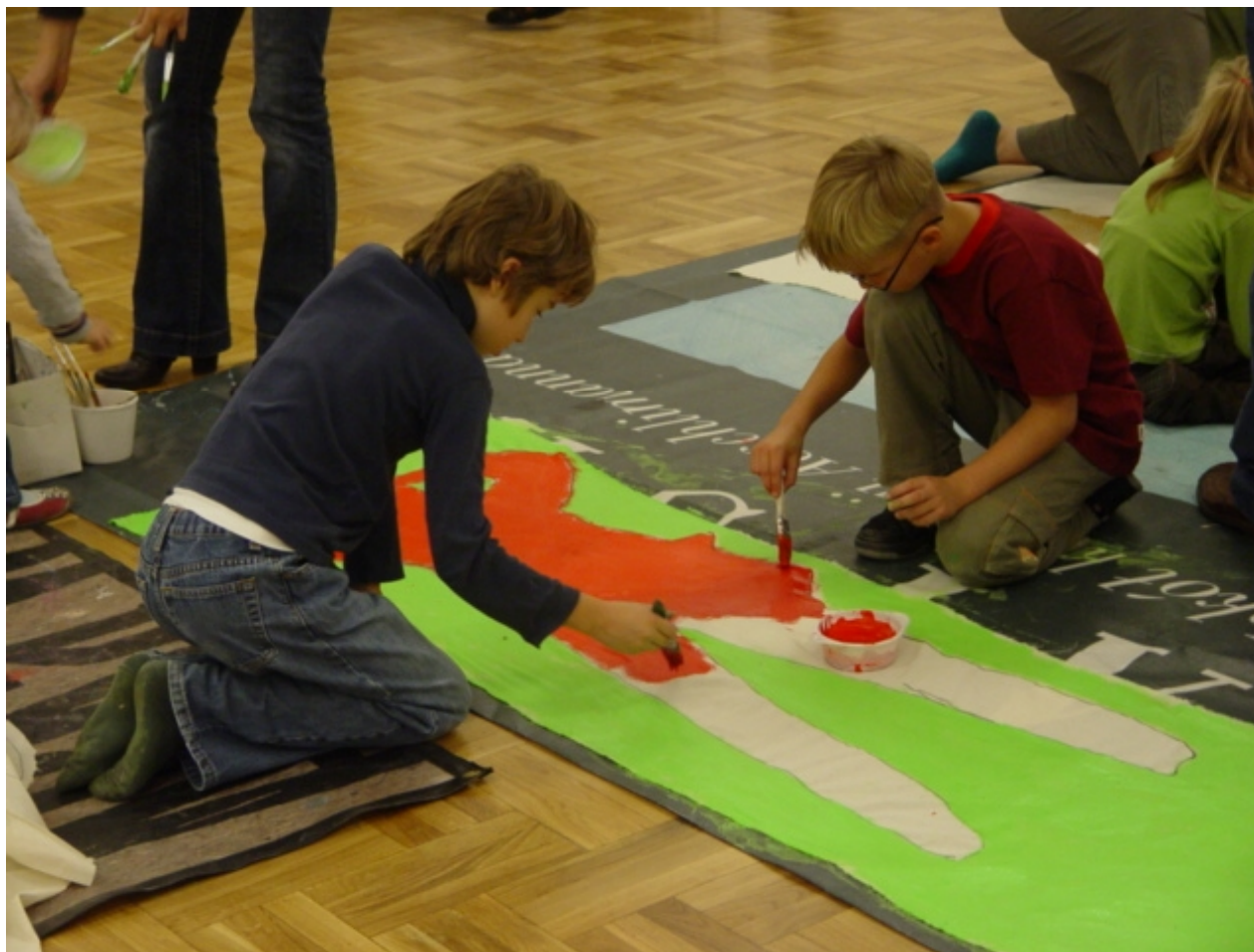
To Sztuka! Puka, 2012