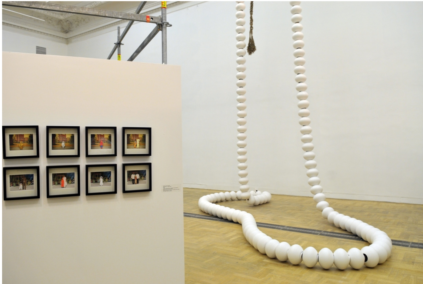
To Sztuka! Puka, 2012